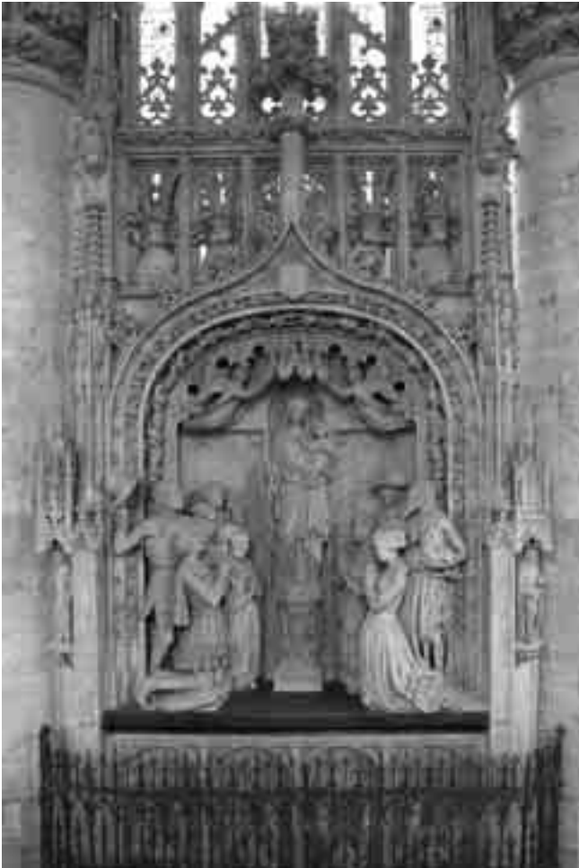
7. Grafmonument voor Engelbrecht I en Johanna van Polanen en hun zoon Jan IV van Nassau en echtgenote Maria van Loon, ca. 1505-1515.