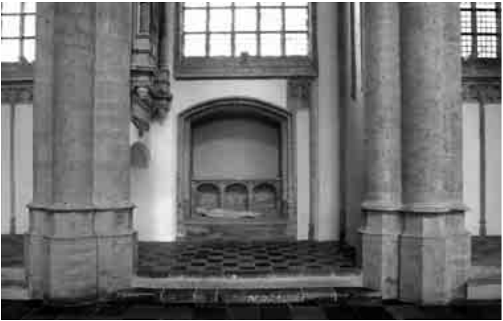
10. Grafmonument voor Jan, Bastaard van Nassau.

kapel als symbolisch beladen cultusmiddelpunt van de Bredase burgerij rond het Kruisrelik nam in maart 1590 definitief een einde.