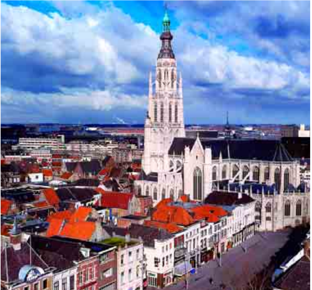
1. Grote of Onze-Lieve-Vrouwekerk van Breda.

te doen als 'stadswaag'. Sinds omstreeks 1540 vormden eenkamerwoninkjes en winkels een rij kerkhuisjes waarvan de meeste pas in de afgelopen eeuw om 'esthetische' redenen werden gesloopt. 7 Langs de noordrand waren bomen neergezet om reigers te laten nestelen. 8 Op de hoek van de latere Havermarkt stond een knekelhuisje. 9 Bij een van de ingangen bevond zich onder een afdakje een 'Ons Lief Heer opten Steen' ofwel een 'Christus op de koude steen'. 10 Elders stond beschermd achter hekwerk een Heilig Graf. 11 Her en der markeerden houten graftekens en stenen zerken, waarvan een deel al in 1580 werd weggehaald, begravingen. 12 Bij bepaalde gelegenheden werd het kerkhofferrein gereinigd en liet men graven ruimen. 13