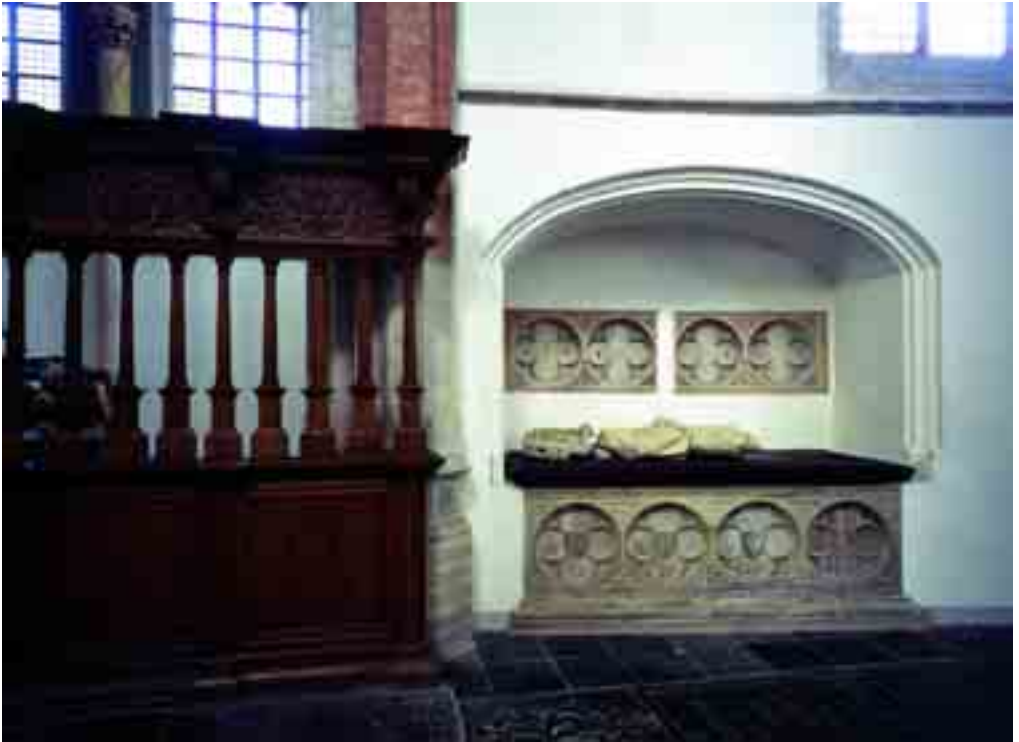
4. Graftombe van Jan III van Polanen voor 1394.