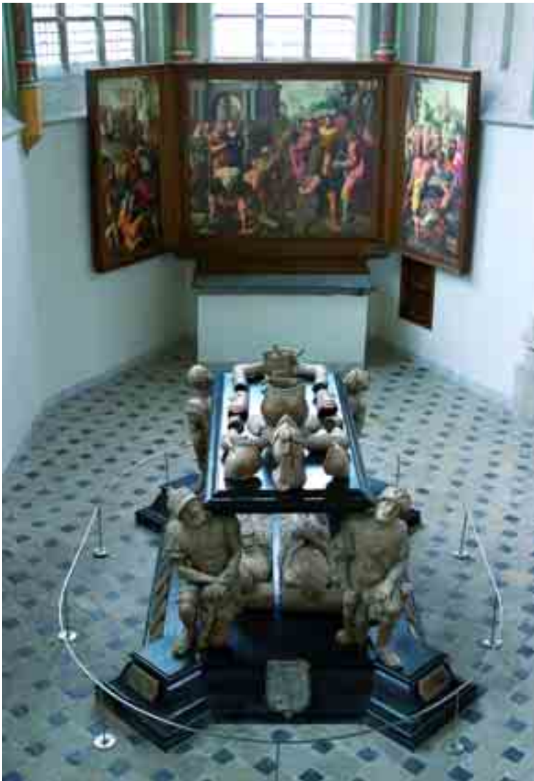
5. Praalgraf voor Engelbrecht II en Cimburgia van Baden. Voormalig Herenkor, later Prinsenkapel.

gevens. Fondsen toevertrouwd aan de Heilige-Geestmeesters blijven lastig te traceren ten gevolge van het verlies van het middeleeuwse archief van de Bredase armenzorg. Een Drievuldigheidsaltaar bestond in 1432 en heeft blijkbaar gefunctioneerd als geïncorporeerd altaar tot 1637. 59 Het altaar voor de Heilige Familie dat de Onze-Lieve-Vrouwebroederschap in 1523 mocht oprichten, vinden we nergens terug. De oudste bekende vermeldingen en in het bijzonder die over het Jacobsaltaar danken we aan losse informatie. Gegevens ontbreken vooral als het beheer van de altaarfundatie in particuliere handen bleef en dus buiten de competentie van de rentmeester viel.