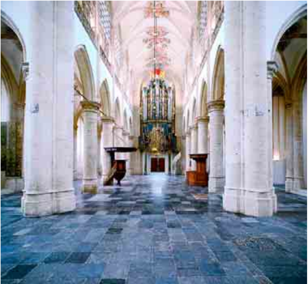
2. Interieur van de Grote of Onze-Lieve-Vrouwekerk van Breda.

Breda exclusief was voorbehouden aan de heer. Diens collatierecht bleef tot 1795 bestaan. Op basis van dit recht deed de heer voordracht van zijn kandidaat aan de kerkelijke autoriteiten en benoemde hem na hun instemming. 14 Omdat de Bredase parochiekerk de status van 'kwart kerk' ('ecclesia quarta') had, voltrok de landdeken van Hilvarenbeek de installatieplechtigheid, waarbij de nieuw benoemde pastoor kelk en missaal kreeg aangereikt.