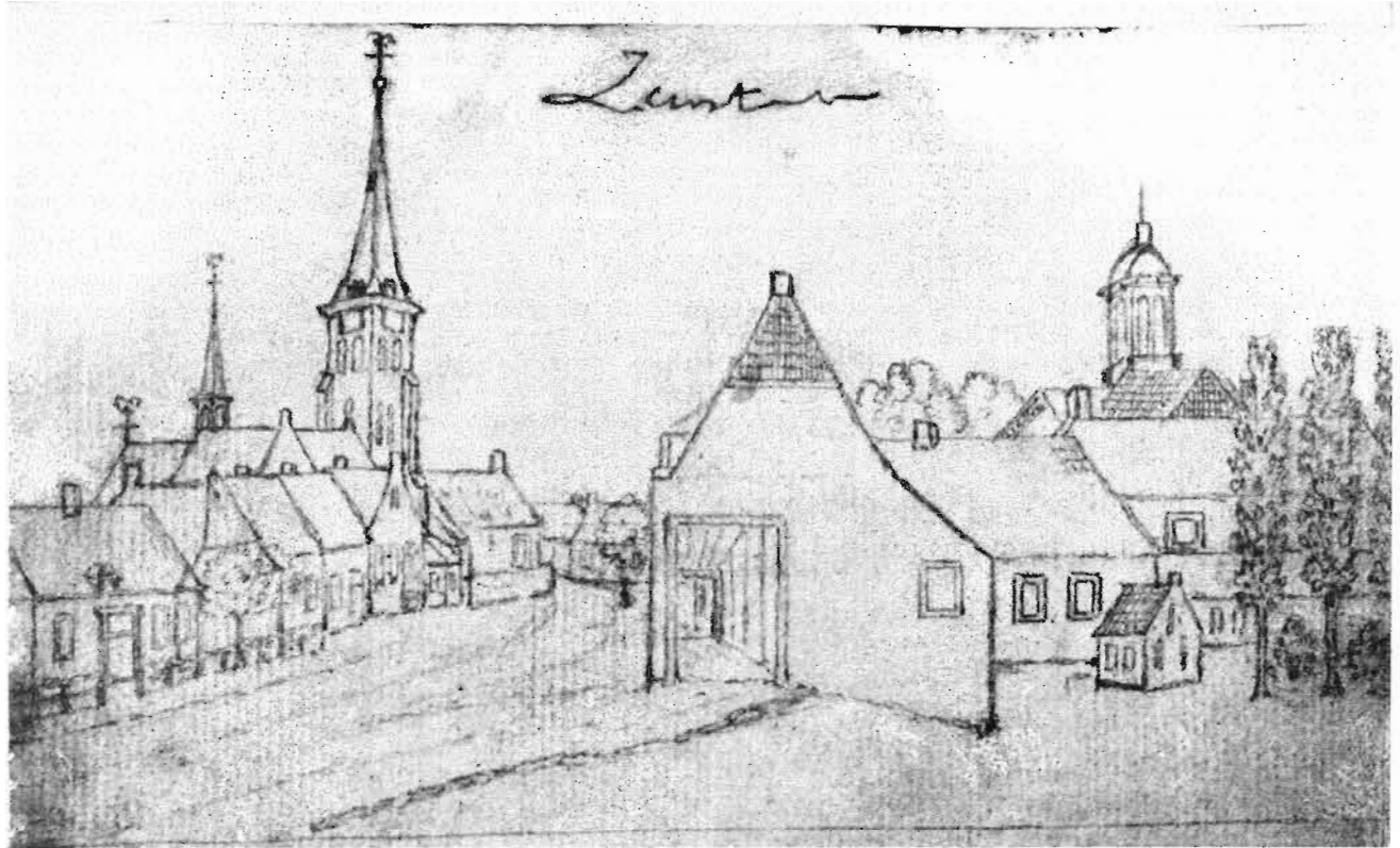
Het dorp Groot Zundert vanuit het Noord-Westen. Op de voorgrond de postschuur (thans bazar). Daarnaast het raadhuistorentje. Ongesigneerde potloodtekening (door G. Goossens) c. 1830. Prentverzameling van het Provinciaal Genootschap te 's-Hertogenbosch. no. 3834.