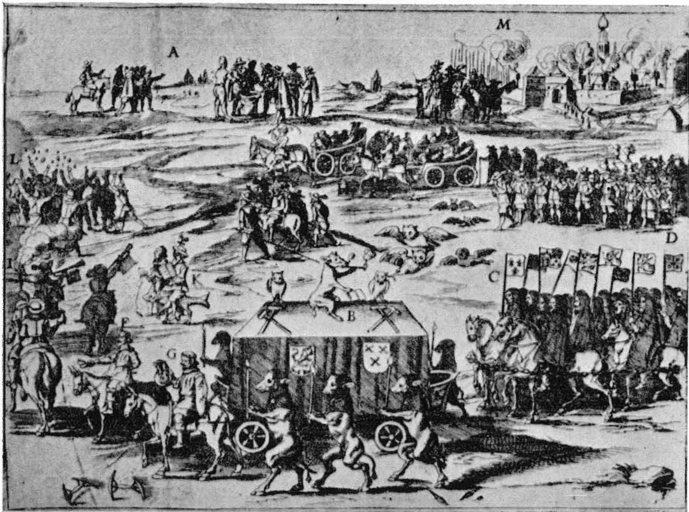
Antwerpse spotprent op de overgave van 1625.

De begrafenisstoet trekt achter de baar in de vorm van een turfschip met de wapenborden van Oranje en Breda de stad uit; daar (rechtsboven) branden de vreugdevuren van de pektonnen al, waarbij dus eveneens het echte Turfschip door het vuur verteerd werd.