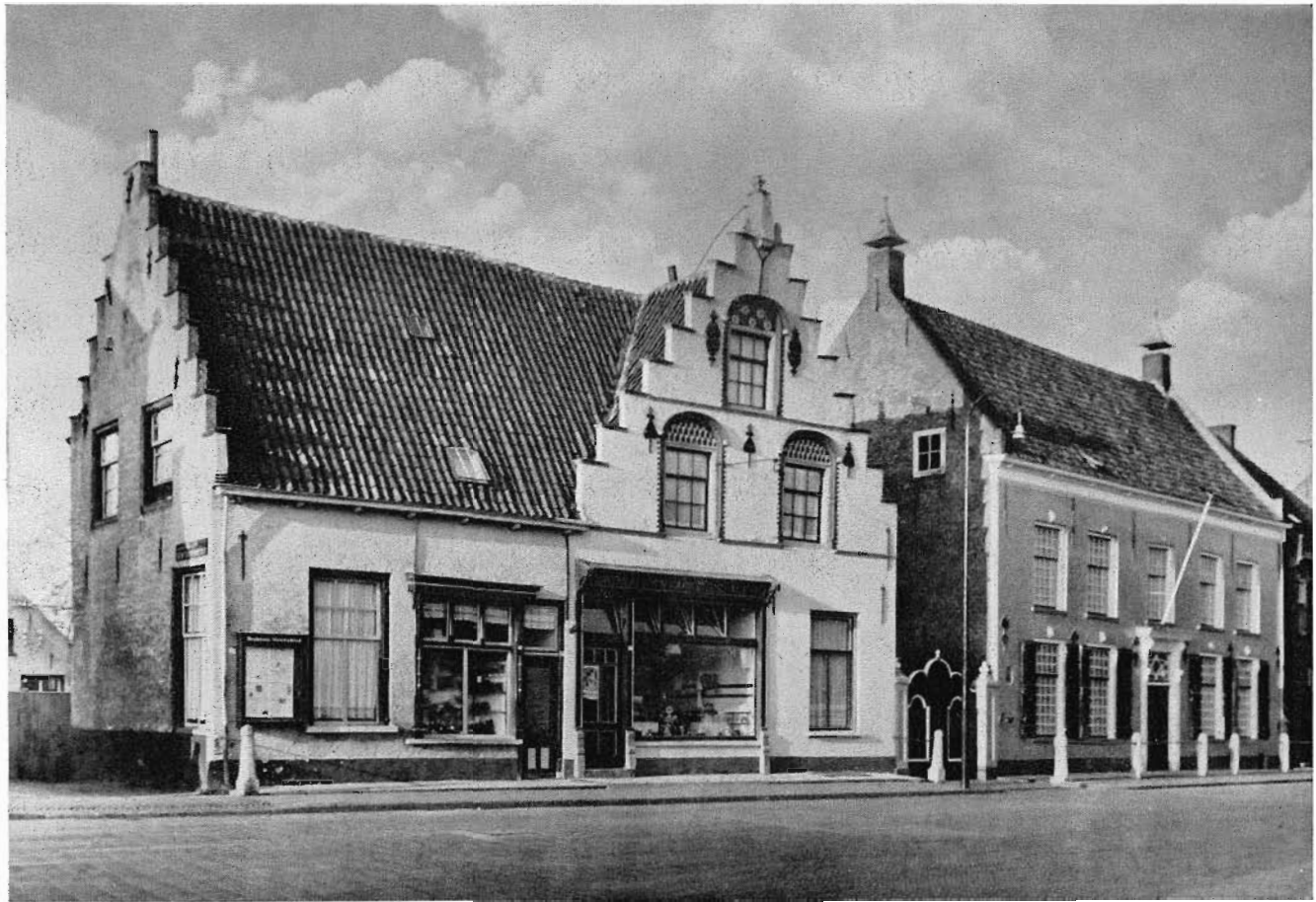
Het huis „De Zwaan” te Etten vóór de restauratie.