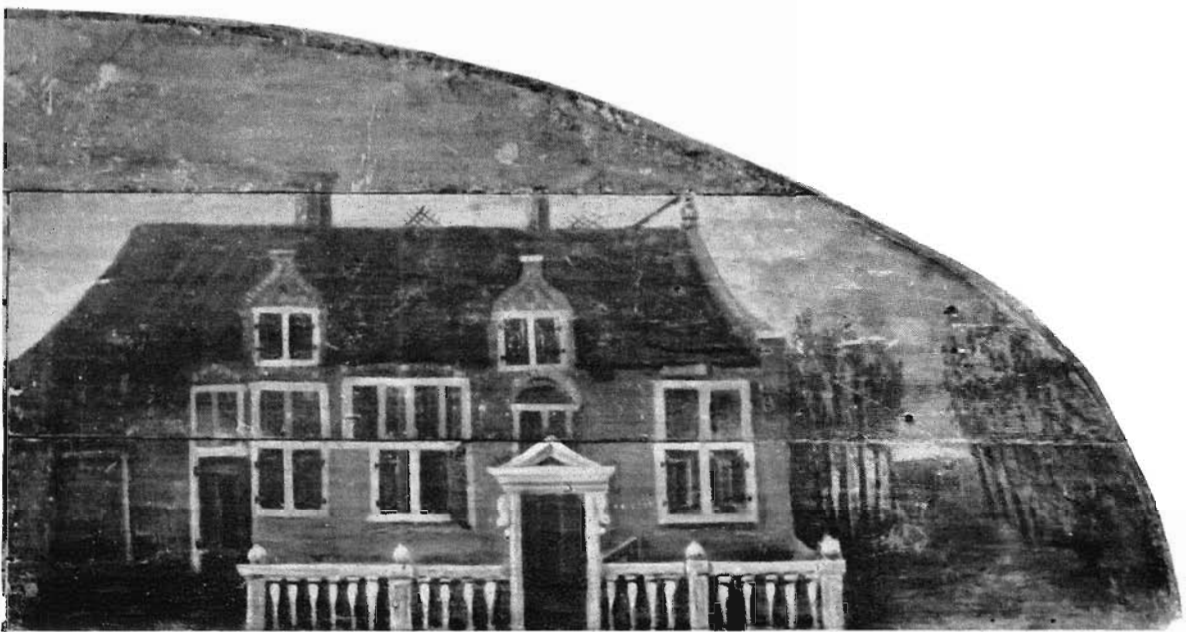
voorstellend de hoeve De Blauwe Kei.