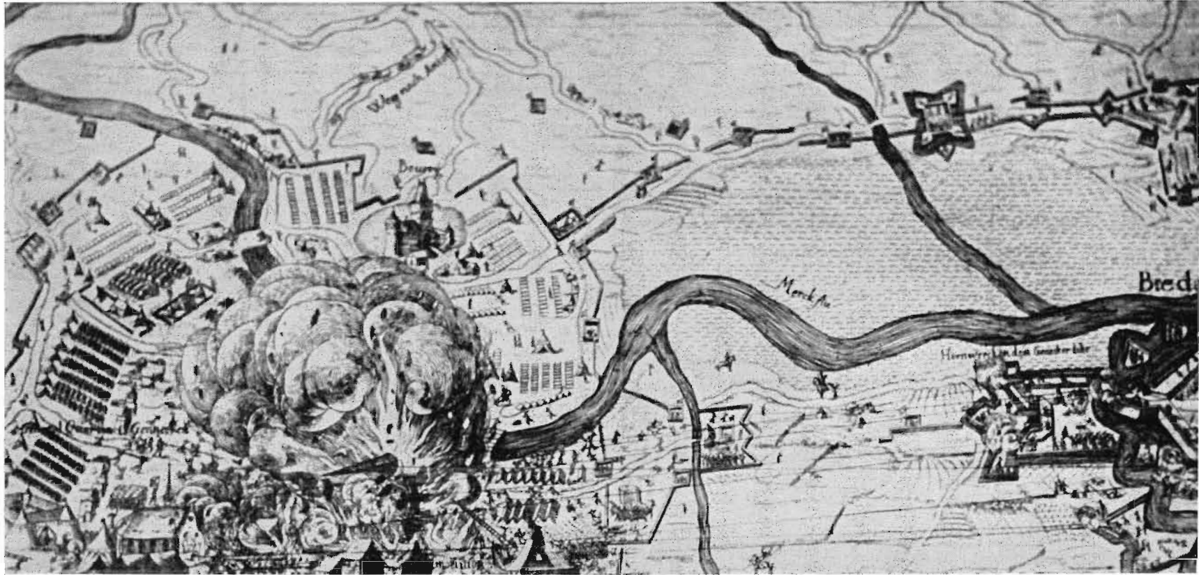
Afb. 14. Fragment van een Duitse kaart der belegeringswerken in 1624/1625, waarop te zien is de zo juist in brand gestoken kerk van Ginneken, dienende als levensmiddelenmagazijn en ammunitiebergplaats der Spanjaarden.