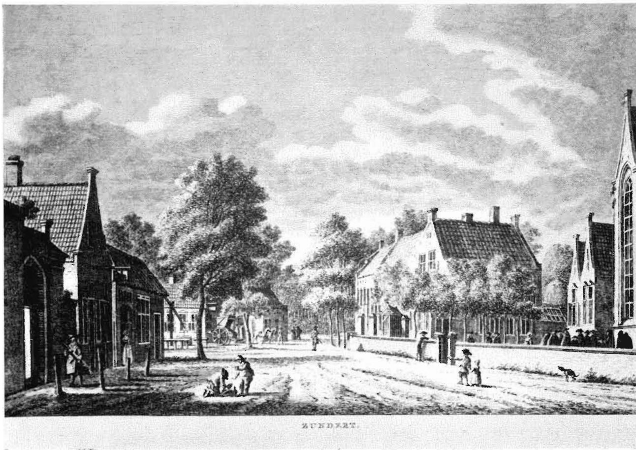
Afb. 4. De Molenstraat te Zundert. Rechts een gedeelte der kerk, met daarnaast het oude dorpshuis. Naar een ets, toegeschreven aan Bendorp en Bulthuis. Or. in het Prov. Gen. Den Bosch.