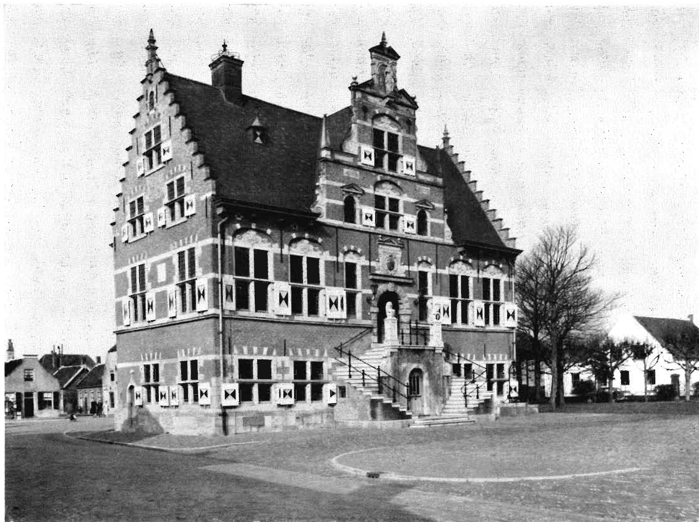
Afb. 8. Raadhuis na voltooiing van de restauratie. Jaarboek De Oranjeboom 13 (1960)