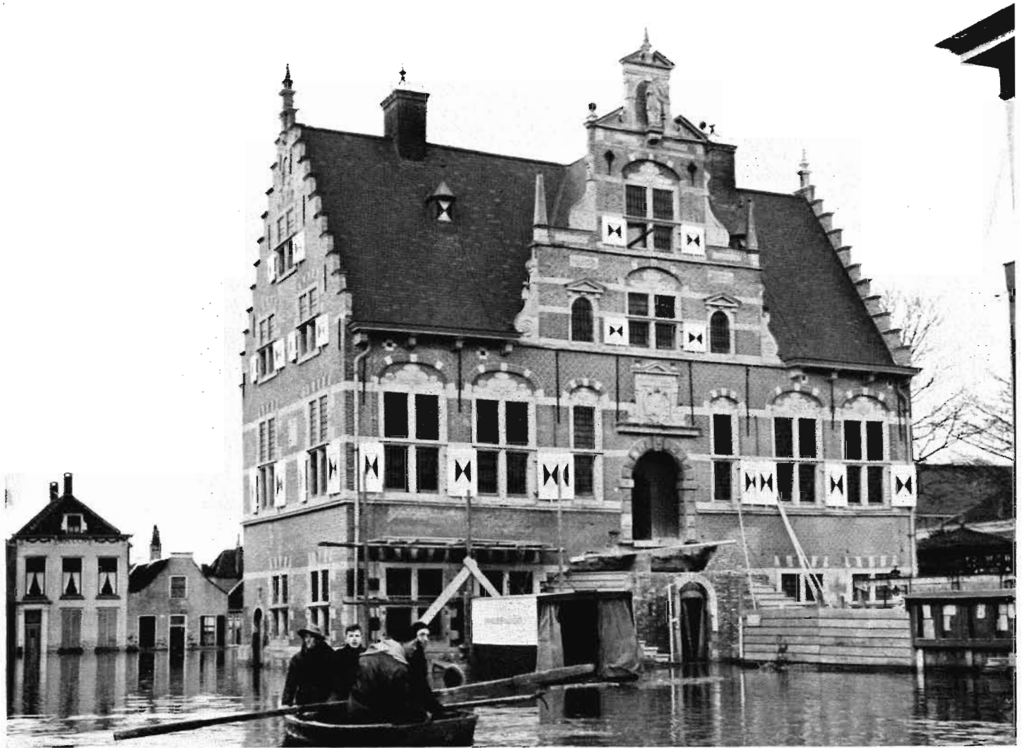
Afb. 7. Raadhuis tijdens de laatste fase van de restauratie; watersnood februari 1953.