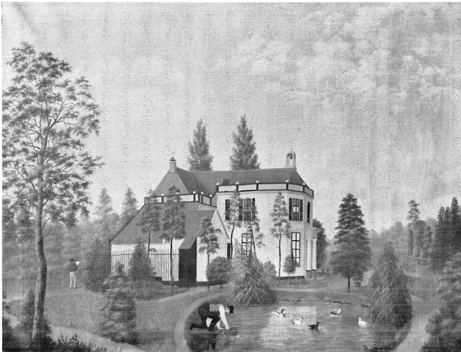
Afb. 6. Zijgevel met remise van de Kleine Ypelaar te Bavel in 1840/41. Jaarboek De Oranjeboom 14 (1961)