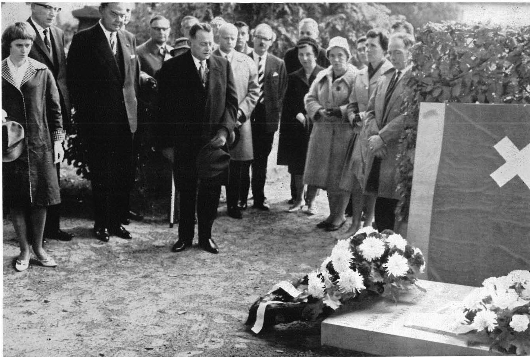
Jaarboek De Oranjeboom 16 (1963)