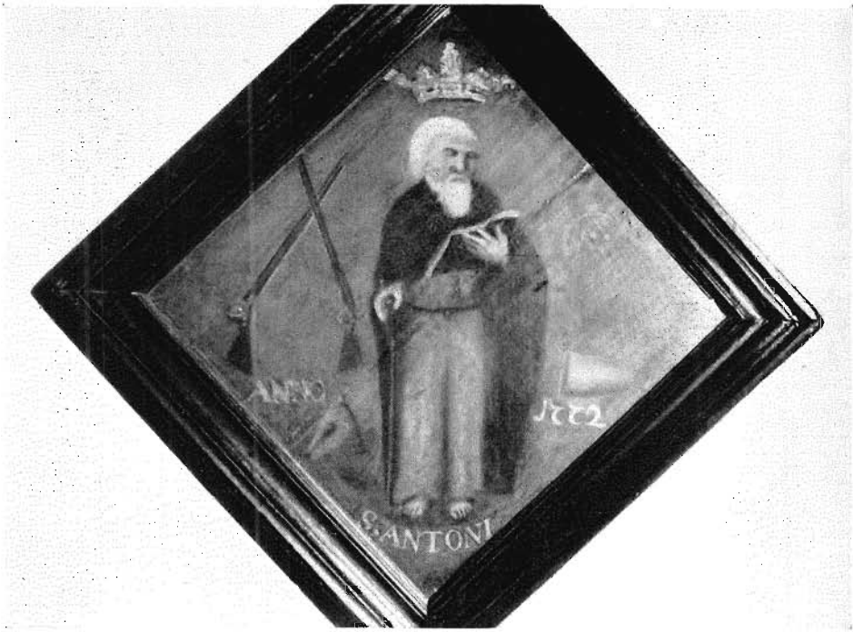
Afb. 33. St. Antonius de Grote. Paneelschilderij. 1772.