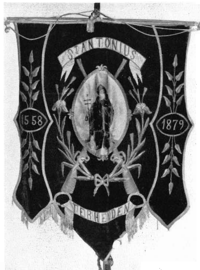
Afb. 32. Vaandel van het St. Antoniusgilde, vervaardigd door J. van Kalken. Middenstuk geschilderd.