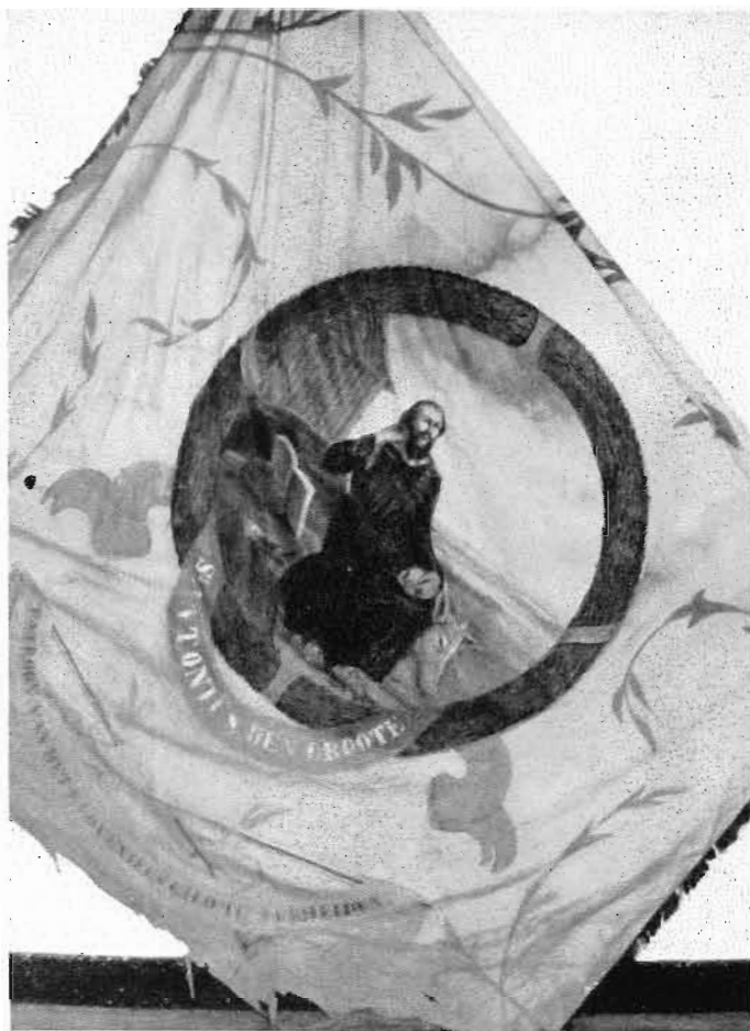
Afb. 31. Gildevlag van het St. Antoniusgilde.