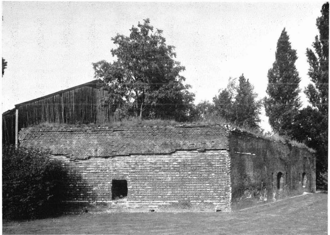
Afb. 9. Het reduit van voormalig Lunet B aan de buitenzijde, gezien vanuit de Hoornwerkstraat, 1965.