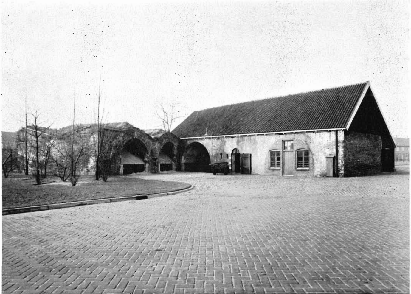
Afb. 10. Het reduit van voormalig Lunet B aan de binnenzijde, 1953.