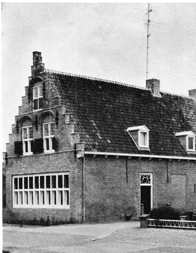
Afb. 14. Huis Alphen Molenstraat 8. 1966. Oost- en noordgevels na de restauratie.