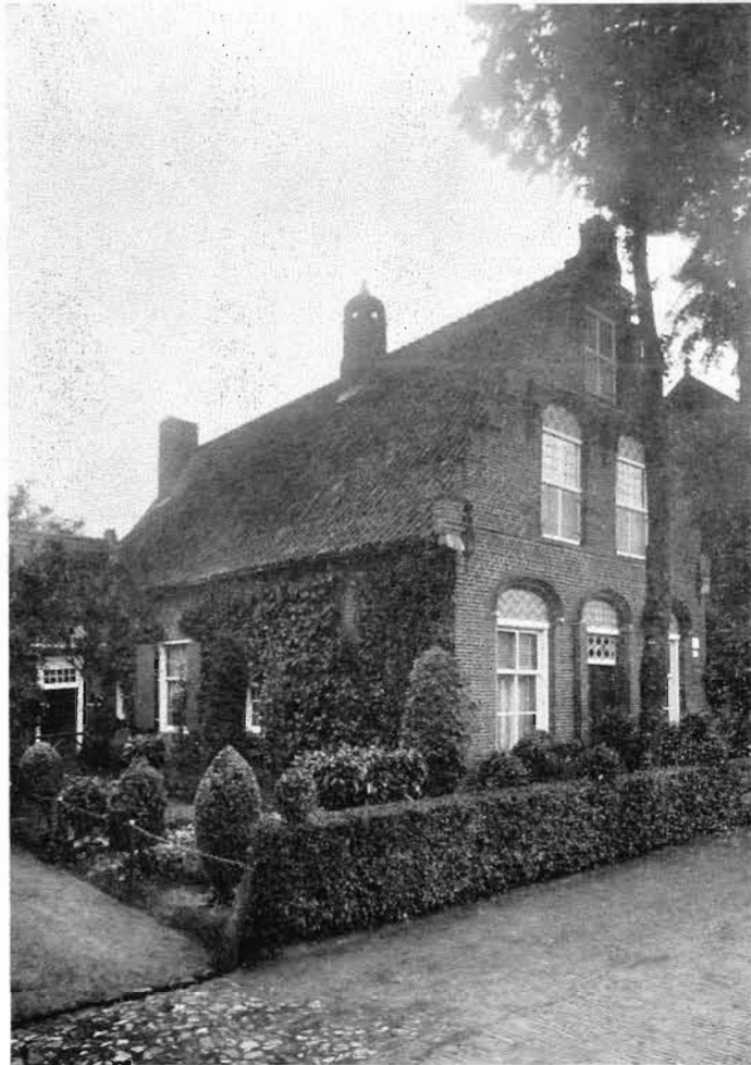
Afb. 12. Huis Alphen Molenstraat 8 omstreeks 1909. Rechts de leerlooierij van de gebroeders Van Baal.