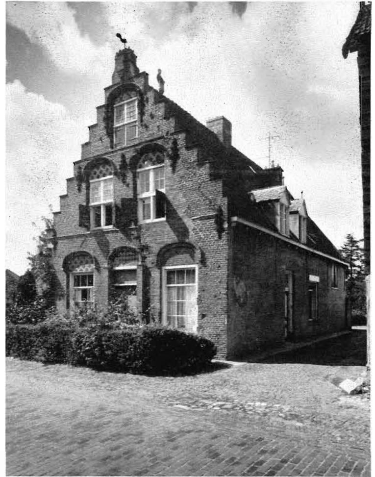
Afb. 13. Huis Alphen Molenstraat 8 omstreeks 1960.