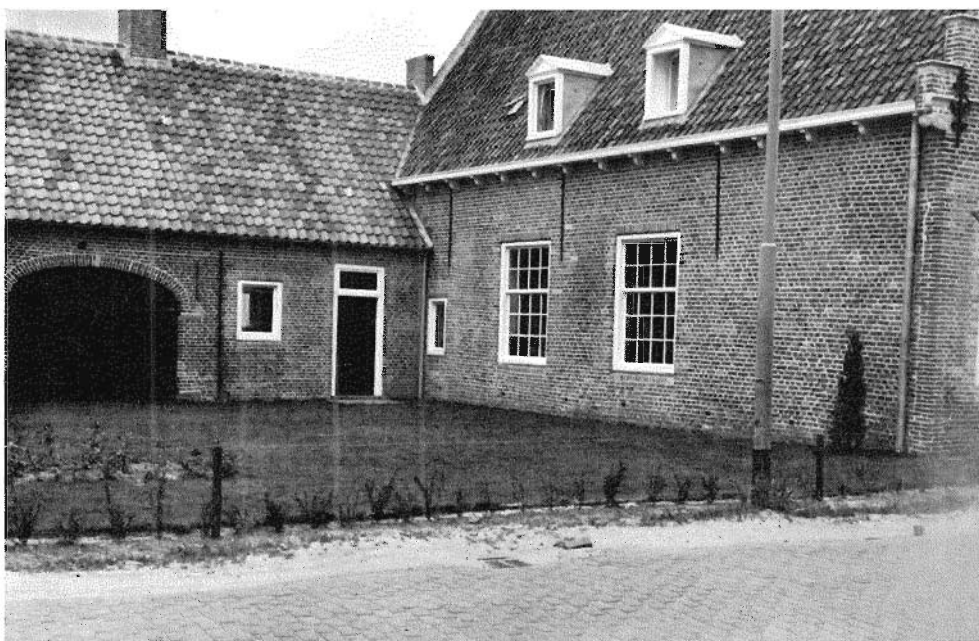
Afb. 15. Huis Alphen Molenstraat 8. 1966. Zuidgevel en gedeelte van zijvleugel na de restauratie.