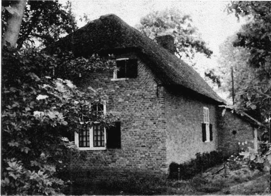
14. Hoeve Grazenseweg 3, Nieuw-Ginneken, vanuit het oosten. juni 1960.