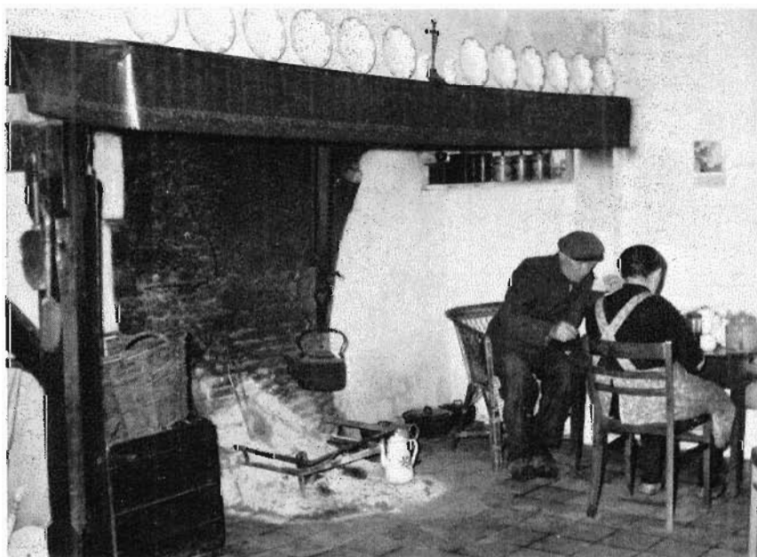
17. Hoeve Grazenseweg 3, Nieuw-Ginneken. Maaltijd bij de haard. juni 1960.