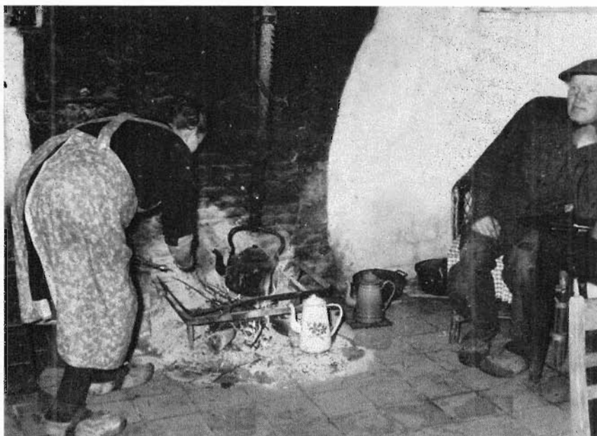
16. Hoeve Grazenseweg 3, Nieuw-Ginneken. Aan de (echte) open haard. juni 1960.