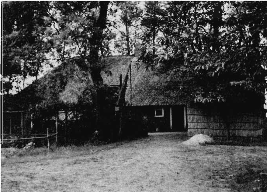
15. Hoeve Grazenseweg 3, Nieuw-Ginneken, vanuit het westen. juni 1960.