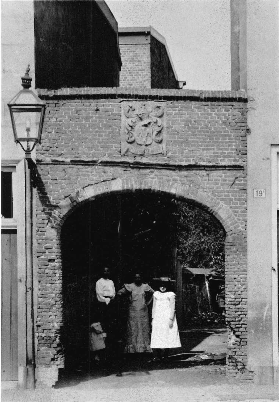
8. Poortje tussen Oude Vest 13 - 19, 1906.