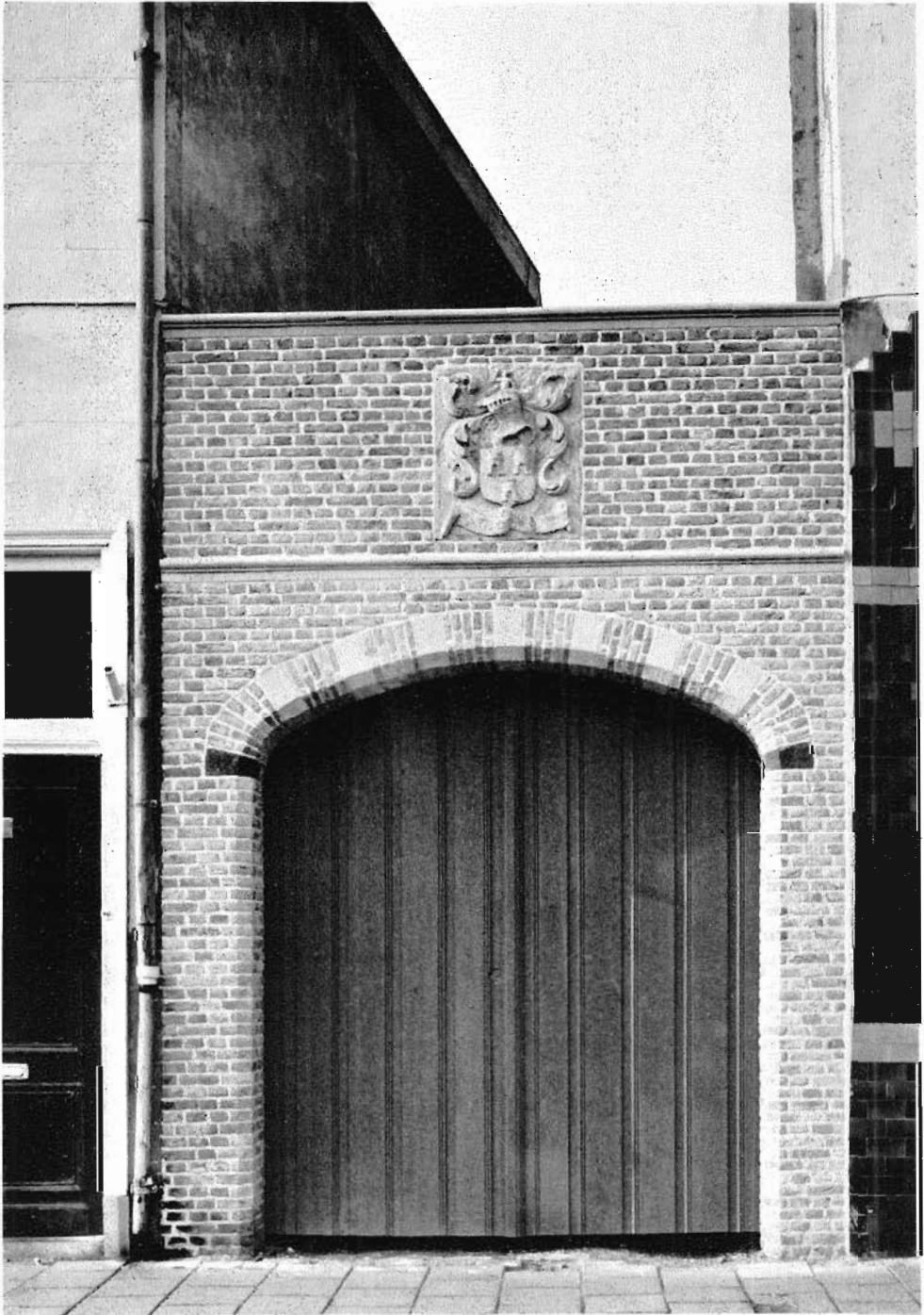
9. Poortje Oude Vest ná de restauratie, 1971.