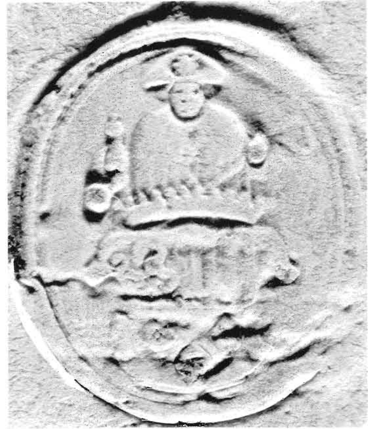
24. Het zegel van Vrouw Jacobsland alias Fijnaart. Het wapen van de markies van Bergen op Zoom, gedekt met een gravenkroon. Achter het schild de patroonheilige St. Jacobus de Meerdere; het hoofd gedekt met een pelgrimshoed, waarop een schelp. In de rechterhand de pelgrimsnap, in de linkerhand de pelgrimsstaf. Zegels van een dergelijke uitmonstering werden in de zestiende eeuw in de meeste dorpen van het markiezaat ingevoerd.

Rijksarchief in Noord-Brabant te 's-Hertogenbosch, Archief van de Raad van Brabant, inv. nr. 342.