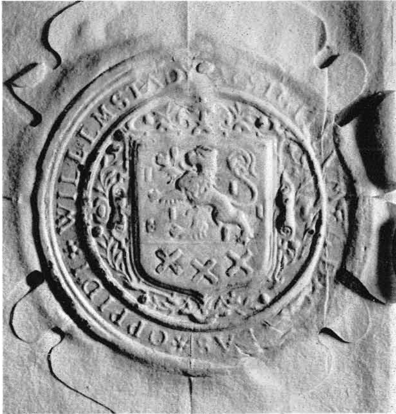
23. Het zegel ten zaken van de stad Willemstad. Het schild stelt voor het wapen van Nassau (Leeuw op een veld met blokjes) met in de schildvoet drie schuinkruisjes. Het schild is omringd met takken en oranje-appelen. Op instigatie van prins Maurits in 1611 ingevoerd in plaats van eerder gevoerde zegels waarop de Brabantse leeuw met het Glymes-wapen.

Rijksarchief in Noord-Brabant te 's-Hertogenbosch, Archief van de Raad van Brabant, inv. nr. 342.