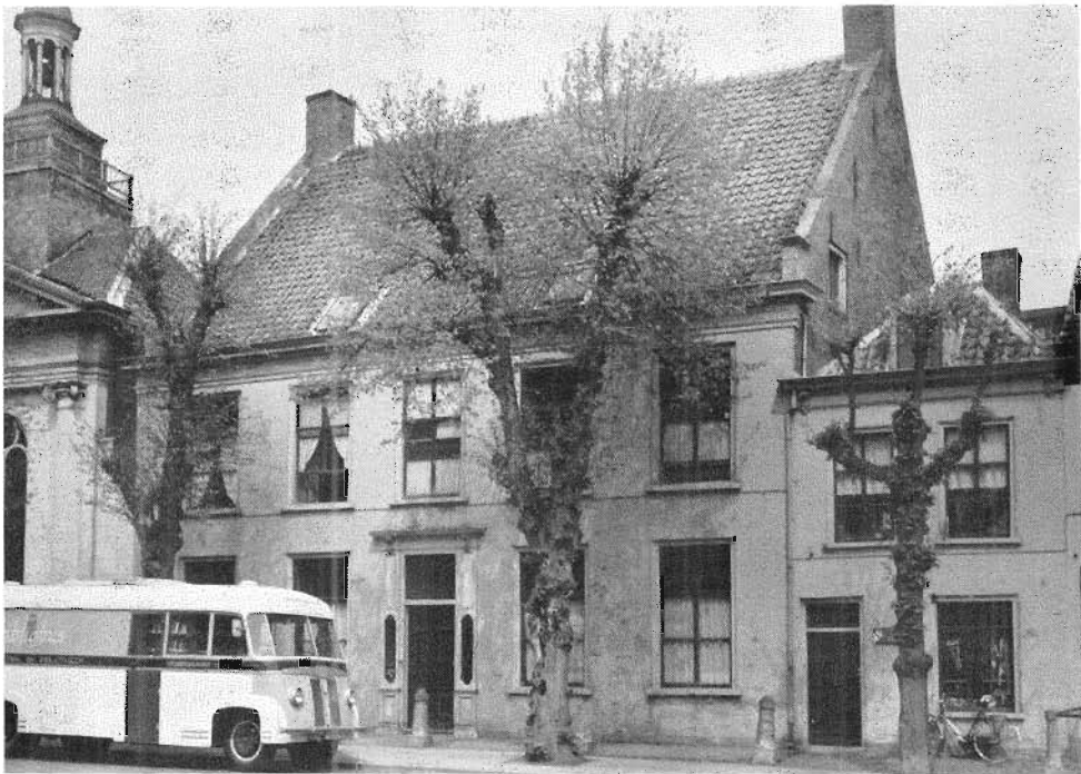
16. De Hervormde pastorie vóór de restauratie, 1964.