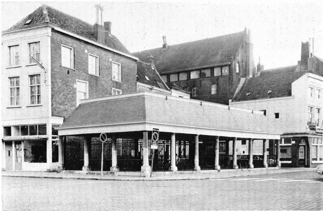
4. De Vishal nà de restauratie, 1969