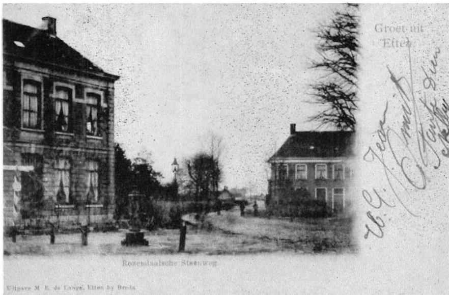
4. De rijksweg Breda-Roosendaal te Etten (ca.1900), met links de notariswoning en rechts de pastorie van de hervormde gemeente.