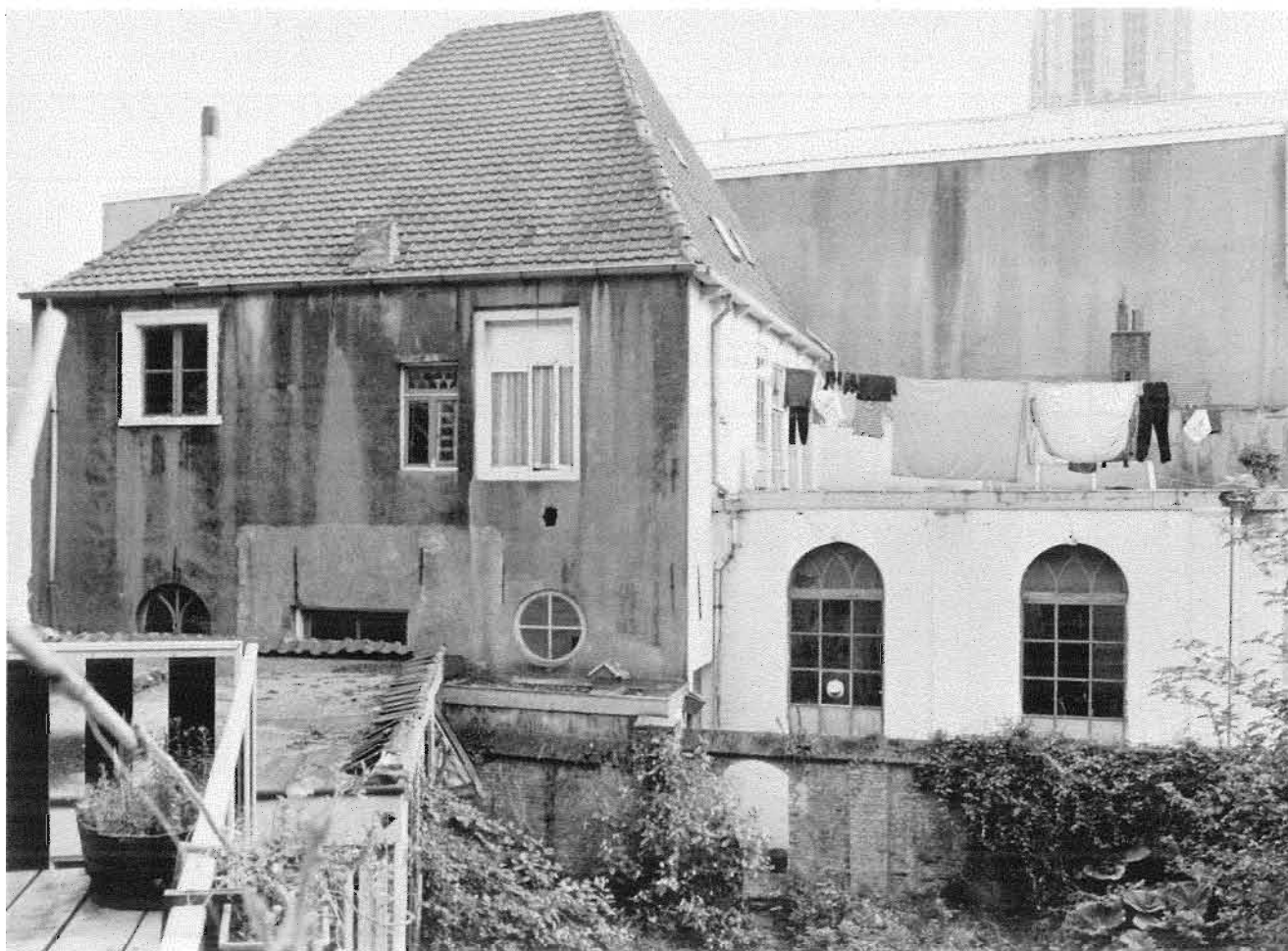
35. Gezicht op het restant van de Synagoge te Breda, met het huis waarin de vergaderingen van Joodse verenigingen en commissies plaats hadden. De bibliotheek en een ritueel bad (?) waren hierin ondergebracht. September 1985.