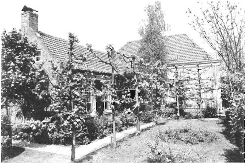
24/25. Woning van Pieter van Ginneken thans Hoolstraat 26. Hier was van 1805 tot 1821/1822 de gemeentesecretarie van Teteringen gehuisvest. Foto's van J. Margés 1987.