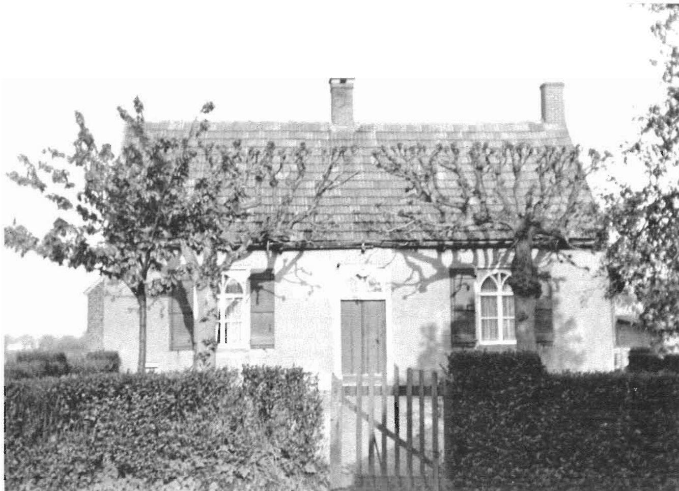
26. Gemeentehuis van Teteringen 1821-1870.