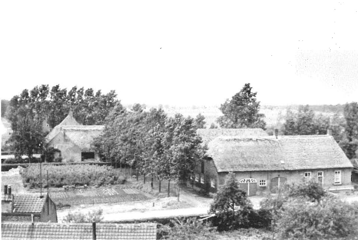
23. Het huis met herberg genaamd De Roskam (rechts), waarin tot 1821 de bestuurders van Teteringen vergaderden, werd omstreeks 1890 vernieuwd en kreeg toen het aanzien dat deze foto vertoont. Het werd in 1964 gesloopt in verband met de realisering van het uitbreidingsplan „Steenbergen”. Op de voorgrond de huidige Zandgouw.