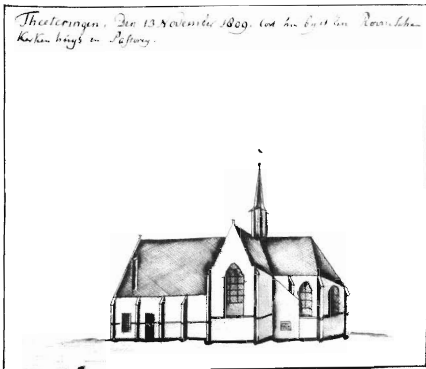
22. Oude kapel van Teteringen in 1809.