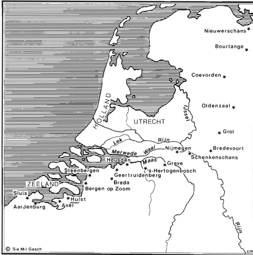
40. Kaart 1: Het reduit en de frontiersteden van de Republiek.