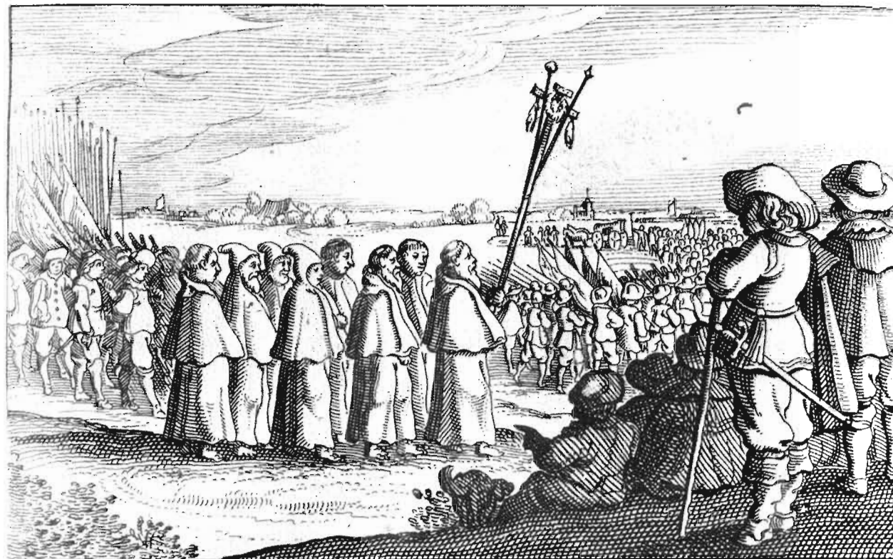
De Soliers, Paep, en Monnicken siet; Breda verlaten met verdriet

47. 10 Oktober 1637. Geestelijken, met het passiekruis hoog geheven, en het Spaanse garnizoen verlaten Breda. Gravure van Claes Jansz. Visscher (1586-1652).