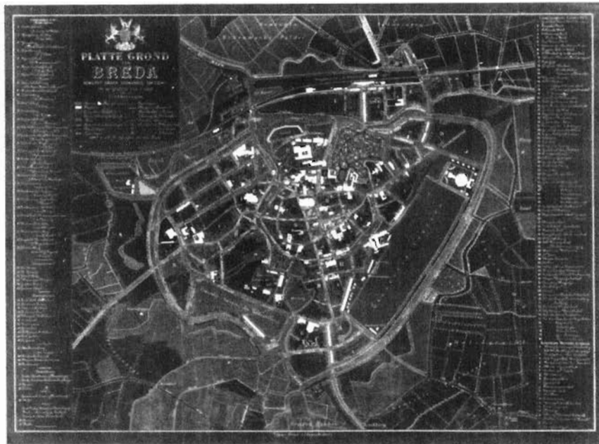
55. Stadsplattegrond van Breda, omstreeks 1890/1892, een uitgave door de firma A.J. Bogaerts te Breda.

op en deze beeldt daarbij het toenmalige marktwezen uit. Tegenwoordig komt de zuivelman weer aan huis. Toen ging je op pad om verse waren te kopen. Handelaren brachten hun eieren in rieten manden mee, hun boter in kartonnen dozen. Algemeen kleepte men zich sober en droeg men steeds een hoofddekse, zoals muts, hoed of pet. Het verschil tussen vrouwelijke kopers en verkopers is waarneembaar. De bewuste foto geeft ook een registratie van het interieur van de Boterhal, die in 1935 bij het reeds op de bovenverdieping gehuisveste museum zou worden gevoegd. Het gebouw zelf werd in 1617 gebouwd als Vleeshal. 12 De boter- en eiermarkt werd met ingang van „de week aanvangende 11 maart 1935” buiten gehouden, na op voorstel van de directeur Openbare Werken te zijn verplaatst naar het Kasteelplein. 13 De markt ging dus terug naar de oude, vertrouwde omgeving!