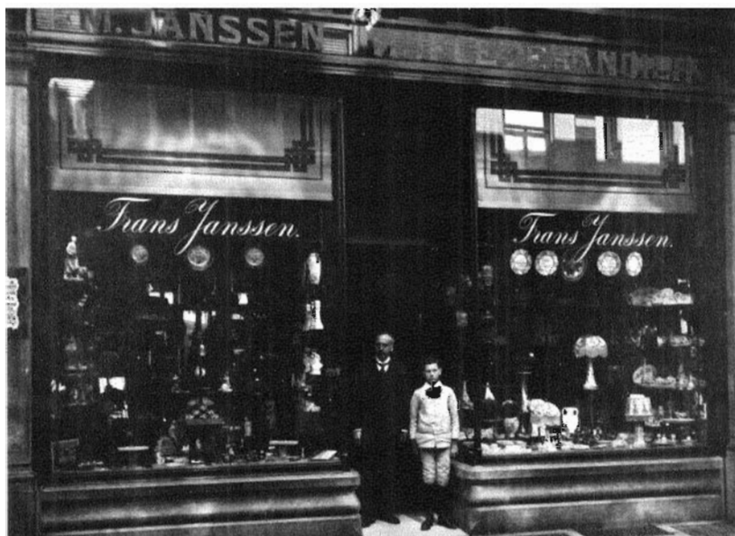
51. Groepsportret voor het winkelpand Lange Brugstraat 19, omstreeks 1915.

De Ginnekenstraat heeft deze aanblik zelfs in versterkte vorm tot op heden behouden.