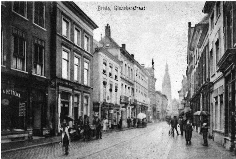
48. Ansicht van de Ginnekenstraat, richting Eindstraat, vóór 1864.