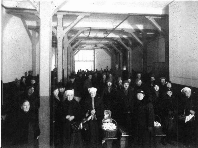
54. Impressie van de laatste boter- en eiermarkt in de Boterhal, Grote Markt 19, 8 maart 1835.

kroning in 1875 moet worden gezien als een aanbeveling. Menigeen schoolde zich in die tijd zelf tot fotograaf of moest noodgedwongen in de leer bij een reeds werkzame collega. Ook ditmaal wordt melding gemaakt van de mogelijkheid tot nabestelling. Volgens het bevolkingsregister was Le Grand sr. omstreeks 1890 ingeschreven op het genoemde adres. Derhalve wordt de bewuste afbeelding gedateerd omstreeks 1890.