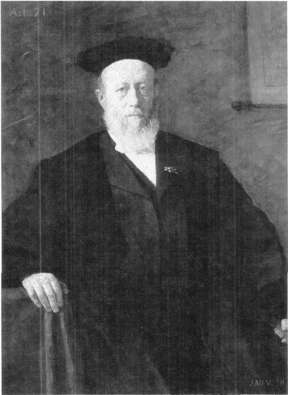
4. Portret van P.J. Veth, geschilderd door zijn neef, de bekende kunstenaar en kunstcriticus, Jan Veth in 1886 (Dordrechts Museum, Dordrecht)