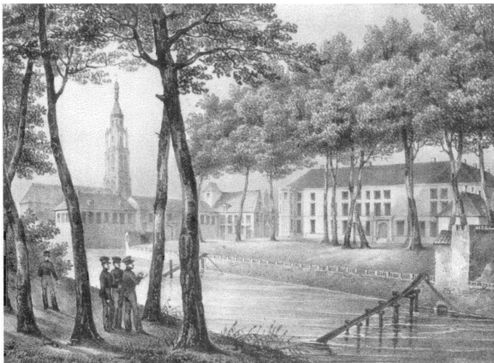
1. De Koninklijke Militaire Academie rond 1830 met links de toren van de Grote Kerk. Litho (coll. Breda's Museum)

tot 17 jaar. Als zodanig kan de KMA als een voorloper van de HBS gezien worden. Per jaar werden 80 cadetten gerecruiteerd en de maximale capaciteit van de KMA lag op 320 cadetten. Het lag aanvankelijk in de bedoeling de helft van elke jaargang voor de koloniale dienst te bestemmen maar het bleek dat gemiddeld negen cadetten per jaar ook daadwerkelijk hun weg naar Nederlands-Indië vonden. 16 Tijdens de duur van hun opleiding verbleven de cadetten intern op het Kasteel enerzijds om hen af te schermen van de 'verderfelijke' stadse invloeden en anderzijds om hen op die manier de militaire geest in te boezemen. Ook tegenwoordig verblijven de cadetten, behalve de laatste jaars, nog intern op het Kasteel.