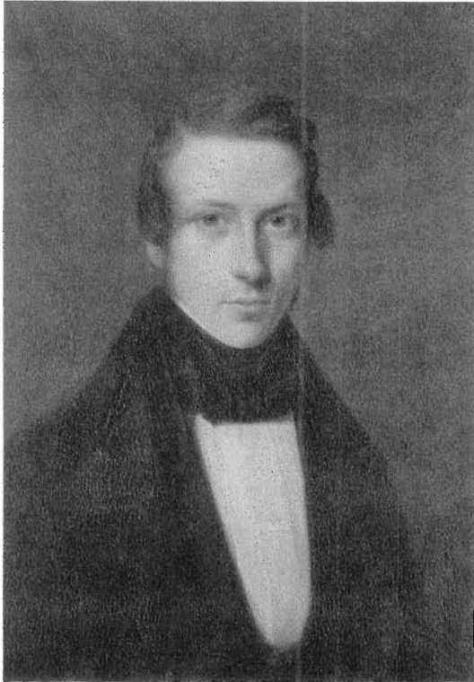
3. Portret van P.J. Veth, geschilderd door diens vriend Isaac Schouman. Paneel 1838-1841 (Rijksdienst Beeldende Kunst, 's-Gravenhage)