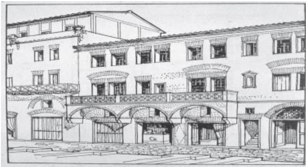
2. Reconstructie van gebouwen in Ostia.

moet worden gezien, of eerder als een stinkend massagraf, omdat er te veel mensen in erbarmelijke sociale omstandigheden op elkaar geperst waren. 19 Daar hadden mensen die zich een dergelijke scholing in de retoriek konden veroorloven geen belangstelling voor.