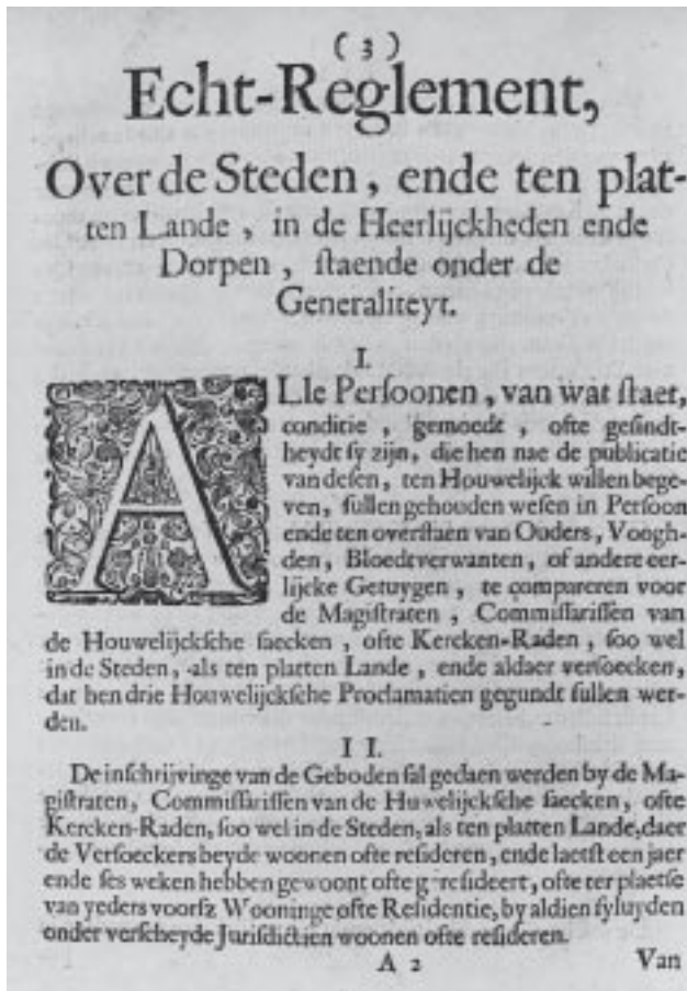
1. Begin van het Echt-reglement uit 1664.

Vanaf 1674 werden door de Staten de verbintenissen in een andere plaats gesloten, op straffe van nietigverklaring, expliciet verboden. 5