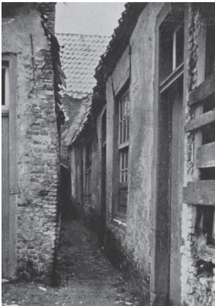
5. Slop op het Nonnenveld, ca. 1905.