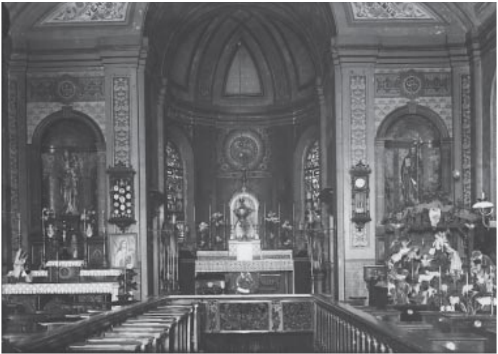
2. Interieur rond 1930.