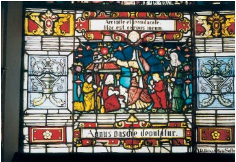
6. 'Het Joods paasfeest'. Onderste tafereel van het raam aan de epistelzijde van het priesterkoor.