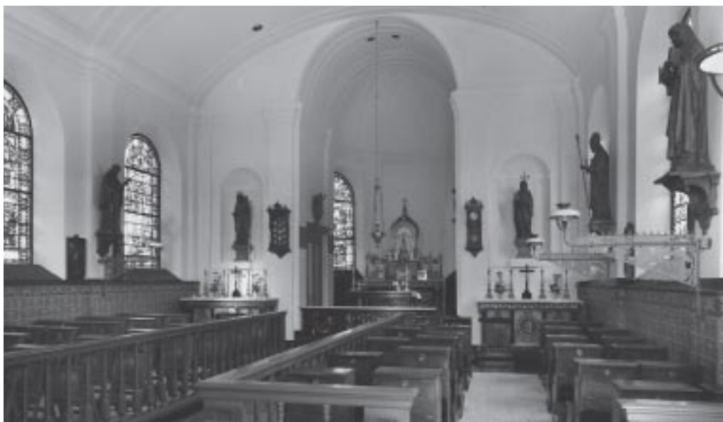
4. Huidig interieur.

Het beeld van Sint Franciscus is tamelijk symmetrisch en frontaal gericht. Een ander zeer frontaal beeld is dat van Sint Blasius. Als bisschop is hij weergegeven met een mijter en staf. Sint Blasius wordt in het Begijnhof speciaal vereerd wegens de Blasiuszegen die rond 3 februari hier nog steeds gegeven wordt.