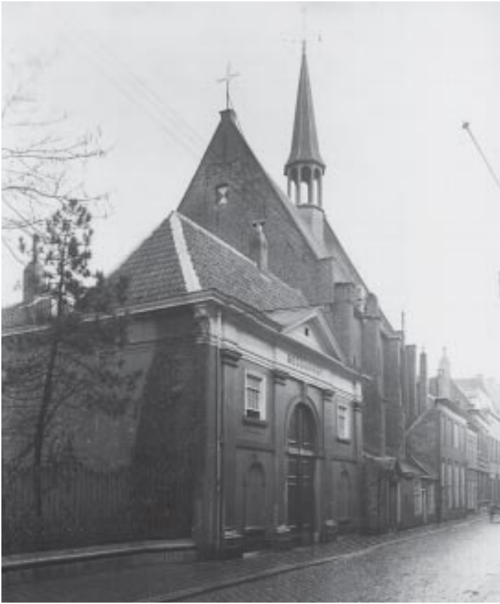
1. Poortgebouw. Gebouwd in 1830, gesloopt in 1952.

daarna de steen van Antwerpen naar het Duitse Cuxhaven (ten noorden van Bremerhaven) vervoeren, en via Rotterdam naar Breda. Het poortgebouw met het huis tegen de Waalse kerk werd voltooid in 1833. Twintig jaar later werd het gerenoveerd. In 1952 werd het poortgebouw met de aanpalende huizen gesloopt.