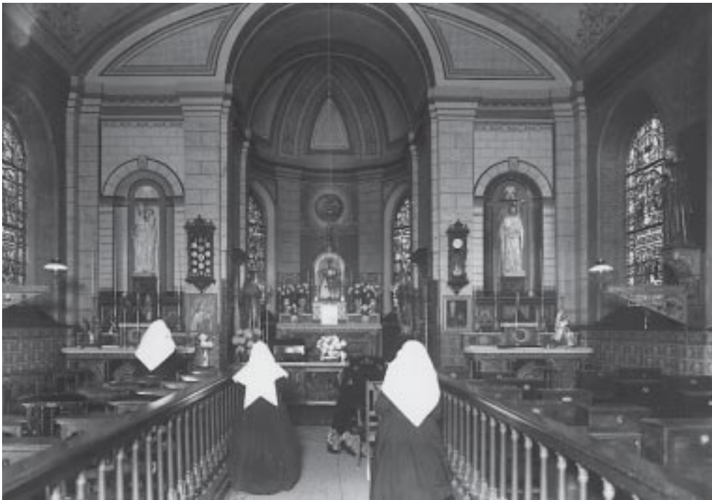
3. Interieur, 1931.

vaak de plaats in van een groot altaarstuk of opbouw met beeldnis. Wat de mensa (het natuurstenen tafelblad met de vijf wijdingskruisjes) van het hoogaltaar betreft is het niet uit te sluiten dat deze uit de oude begijnhofkerk komt.