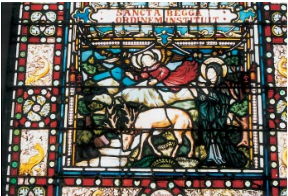
7. 'Redding van St. Begga'. Onderste tafereel (II/2) van het middelste raam uit de cyclus met het leven van St. Begga.