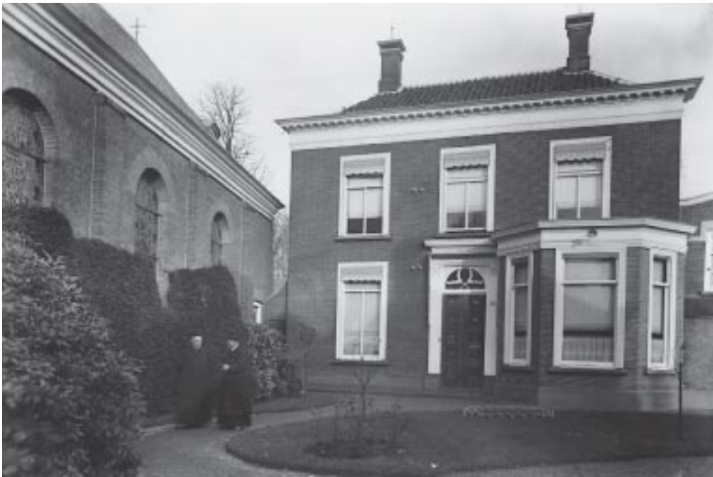
9. Pastorie, 1931.