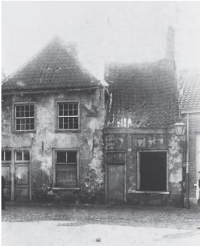
6. Huisjes aan de Achterom, gesloopt in 1916.

Tot slot gaf Vissers er nog anderszins blijk van het arbeidersbelang hoog te achten. Zo sloot hij zich aan bij een voorstel van B. & W., waarin een ongevallenverzekering voor de gemeentewerklieden werd geregeld. Vervolgens gaf hij te kennen het nuttig en gewenst te achten als de gemeente een financiële toezegging deed aan het te Amsterdam gevestigde Centraal Bureau voor Sociale Adviezen (CBSA). 77 Het CBSA, in 1899 door enige radicalen in het leven geroepen en terzijde gestaan door personen van uiteenlopende politieke signatuur, vergaarde informatie over de toestand van de arbeidende klasse en fungeerde tevens als adviesorgaan voor de arbeidersorganisaties. Blijkbaar sprak het in Breda tot de verbeelding, want een raadsmeerderheid beloofde deze aanvraag van Vissers. En blijkens de verdere geschiedenis van het CBSA heeft hij deze instelling duidelijk op waarde geschat. 78