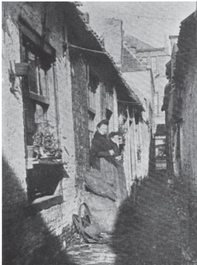
5. Slop op de Haagdijk, ca. 1905.

de oprichting van een (neutrale) kleuterschool en subsidie voor het Burgerlijk Armbestuur, ter verschaffing van versterkende middelen aan behoeftige kraamvrouwen. Tevens stond Vissers achter uitbreiding van het tekenonderricht aan de Ambachtsschool en wenste hij, bij aanbesteding van kachels voor schoolgebouwen, de kleine smidsbedrijven te bevoordelen boven de grote firma's, hoewel het college van B. & W. de laatsten prefereerde.