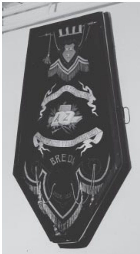
2. Het nieuwe vaandel van de neutrale typografenbond uit 1912.