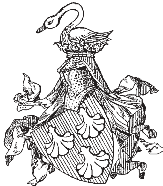
6. Het wapen van het geslacht Van Keppel, getekend in gotische stijl.