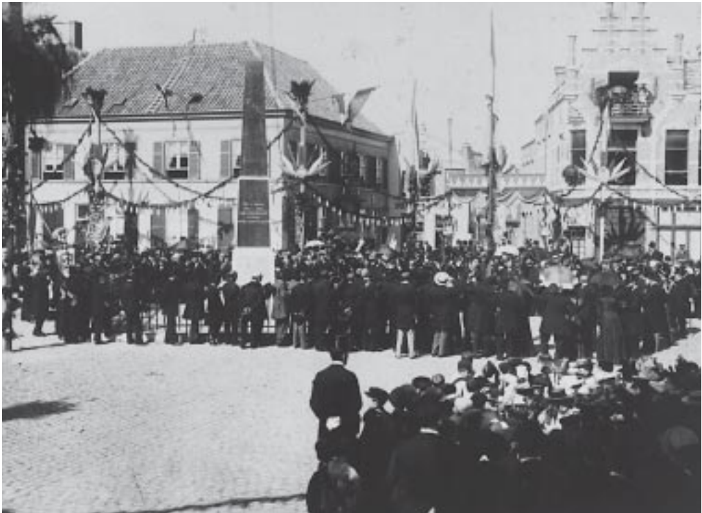
5. De onthulling van de obelisk op 6 september 1898 op de Markt in Princenhage.