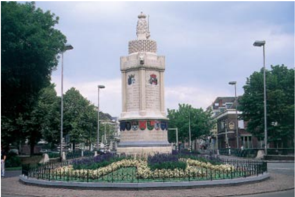
1. De achterkant van het Baroniemonument aan de ingang van het Valkenberg in Breda.

Het monument is opgericht in 1905. Op het einde van de negentiende en aan het begin van de twintigste eeuw zijn in Engeland en Duitsland veel monumenten opgericht die het nationale verleden moesten verheerlijken. In Nederland was men wat bescheidener. Het monument in het Valkenberg is één van de weinigen in zijn soort, naast het monument in Heiligerlee en de standbeelden van Vondel in Amsterdam, Jan Pieterszoon Coen in Hoorn en Michiel Adriaanszoon de Ruyter in Vlissingen. 1