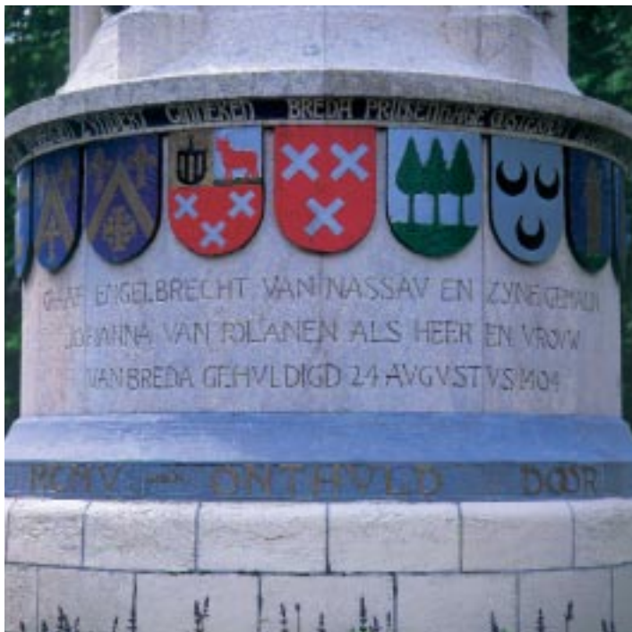
8. De gemeentewapens van Breda, Ginneken en Bavel en Princenhage op het monument.

Terheijden, Teteringen, Oosterhout, Dongen, Gilze en Rijen, Ginneken en Bavel, Alphen en Riel, Baarle-Nassau, Chaam, Zundert, Rijsbergen, Roosendaal en Nispen, Etten en Leur, Rucphen c.a. en Princenhage deel moeten uitmaken van de baronie. In het voorstel van de commissie uit de gemeenteraad nopens het plan tot herdenking van het 500-jarig bestaan van het Huis van Oranje-Nassau als Heren en Baronnen van Breda, dat op 2 april 1904 in de raad werd gebracht, worden echter ook Steenbergen, Gastel, Oudenbosch, Hoeven, Standaardbuiten en Fijnaart genoemd. De commissie baseerde zich hierbij op Roest van Limburg, die op pagina 30 van zijn boek een tijdelijke verdeling beschrijft tussen het Land van Breda en dat van Bergen op Zoom die gold in 1350.