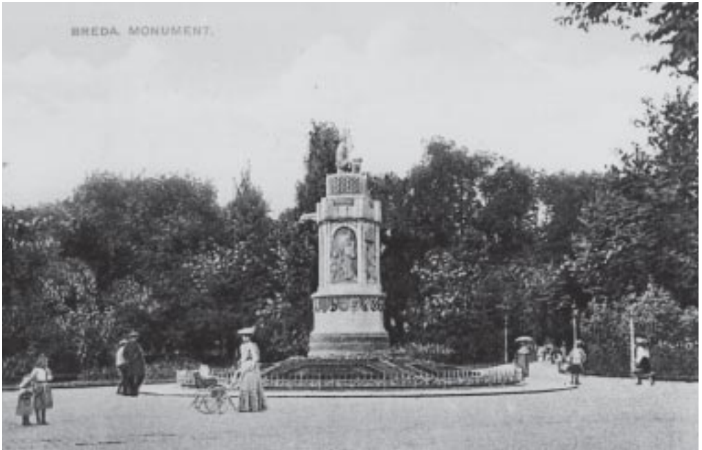
4. Het monument in het Valkenberg, niet lang na de onthulling. Prentbriefkaart, afgestempeld in 1909.

De baronie van Breda bestond als heerlijkheid niet meer sinds 1798. Tijdens de Bataafse Republiek waren de heerlijke rechten afgeschaft. Deze rechten zijn wel gedeeltelijk hersteld in 1814, maar in een traktaat van 1801 had de latere koning Willem I afstand gedaan van al zijn bezittingen en waren zijn rechten overgegaan aan de Bataafse Republiek. 9 Ook als bestuurlijke eenheid hield de baronie op te bestaan. A.J. van der Aa spreekt dan ook in zijn bekende aardrijkskundig woordenboek over de voormalige baronie van Breda. Volgens hem had koning Willem I hier nog enige heerlijke rechten, zoals het recht van collatie in de stad Breda en in de dorpen, dat wil zeggen het recht om de predikanten van de Nederlands Hervormde Kerk te benoemen. 10 De voormalige goederen van de Nassaus, zoals het Mastbos, het Liesbos, de andere bossen, verschillende Prinsenhoeven, het Kasteel van Breda, het park Valkenberg enzovoorts, bleven eigendom van de Staat en zijn dat tegenwoordig grotendeels nog.