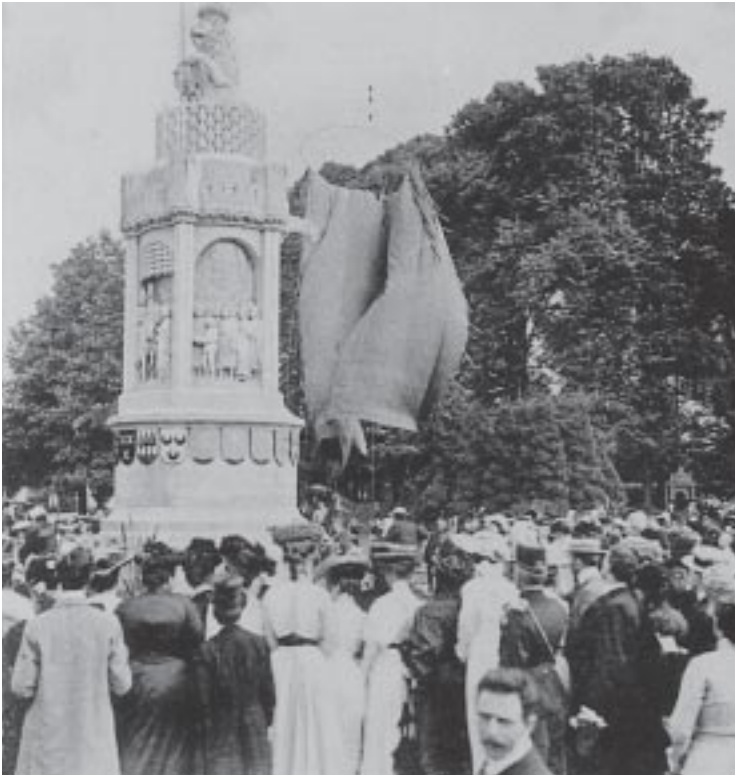
3. De onthulling van het monument door koningin Wilhelmina op 3 juli 1905.

het opnieuw geleverde bewijs van de trouw van mijn volk zal mij tot steun strekken bij de vervulling mijner roeping , aldus Wilhelmina. De koningin deed eigenhandig het omhullend doek rond het monument vallen en tekende de oorkonde die ingemetseld zou worden.