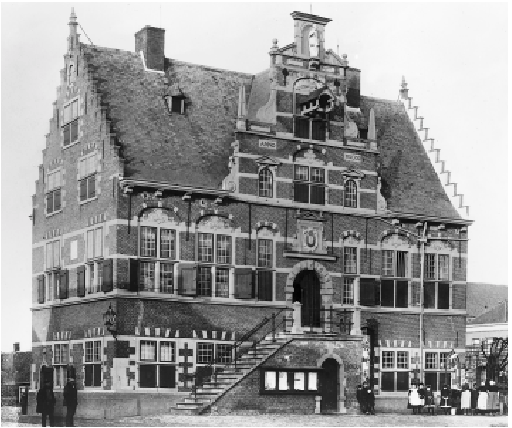
3. Het Klundertse raadhuis zoals het er in de vorige eeuw uitzag.

deren moest inventariseren. Hij wees de twee dienaren aan om hem daarbij te assisteren.