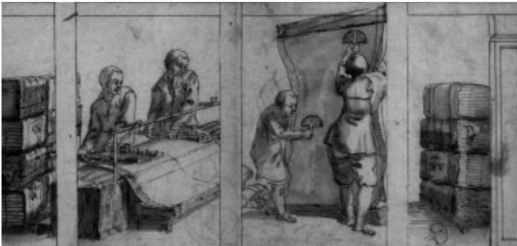
4. Aan Jacob de Gheyn toegeschreven ets van droogscheerders (eind zestiende eeuw).

werden gevoerd om te verven. 44 Een sterk Leids argument was, dat in de stad en baronie van Breda een droogscheerder met zijn gezin een beter bestaan had met een dagloon van 15 stuiver dan zijn collega in een Hollandse stad met een halve rijksdaalder. 45