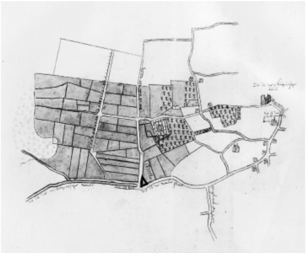
3. De Oosterhoutse vaart. ARAH, Nassause Domeinraad 11877, f 143v, mei 1643.

tot een gezonde bedrijfstak leidde. 22 Het wolwerk kwam in deze grote meierijsdorpen niet van de grond, niet in het minst doordat zij de snelle verbinding met Holland misten, het belangrijkste voordeel van Oosterhout.