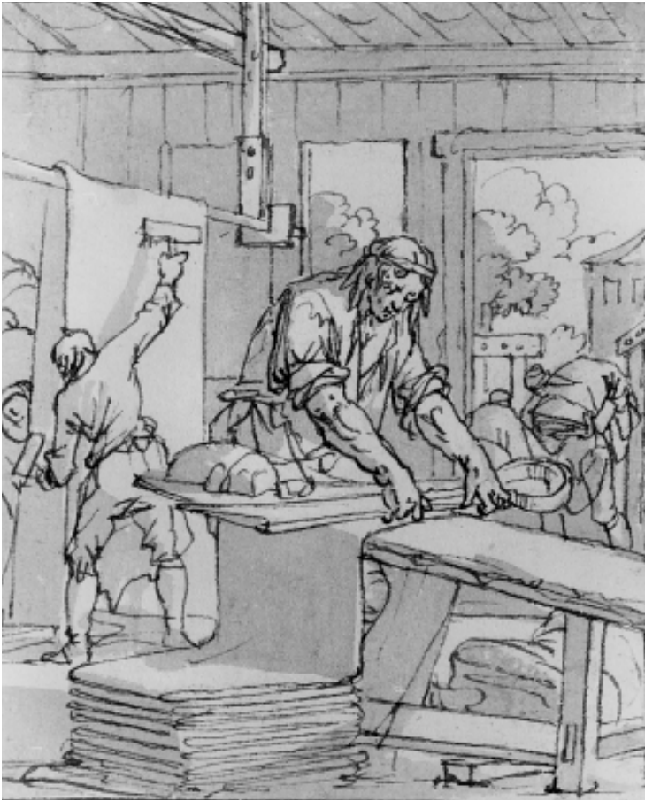
2. De droogscheerder. Voorstudie voor een prent in Het menselyk bedrijf van Jan Luiken. Amsterdams Historisch Museum.