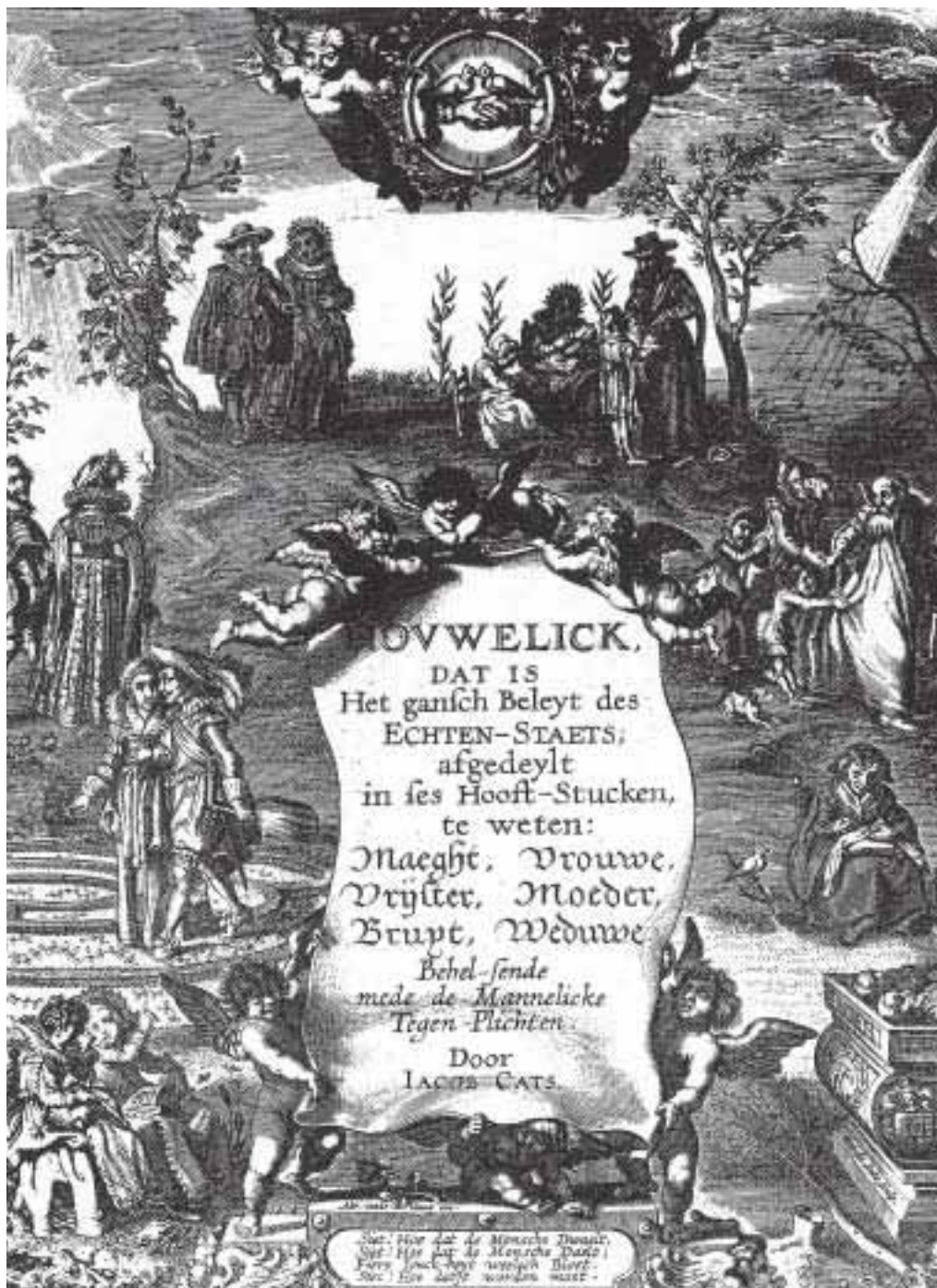
5. Pieter de Jode naar Adriaen van de Venne, Titelprent van Jacob Cats, Houwelick (Middelburgh 1625).