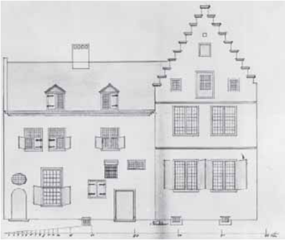
2. De kerk in de Nieuwstraat in 1763.