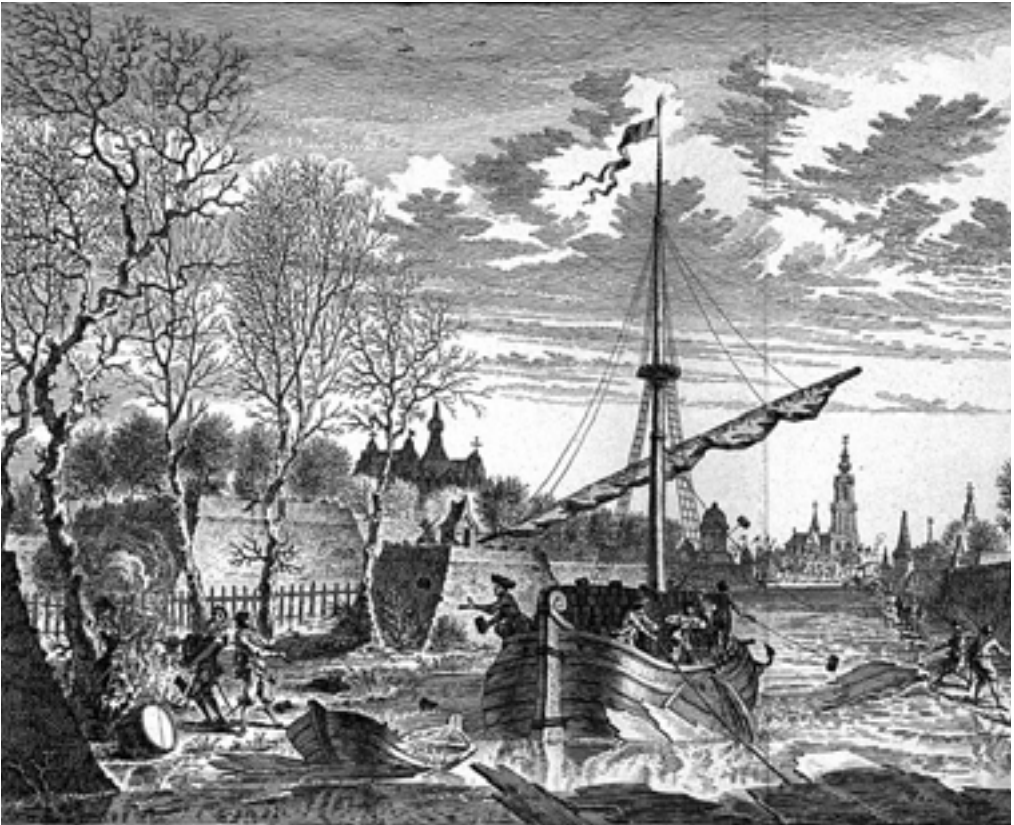
2. Het Kasteel van Breda verrast, door middel van een Turfschip, in het jaar 1590.

het om draaide was dit: terugkeer van rust en orde en verandering van het beleid van Filips II. Hoewel Margaretha van Parma de toestand min of meer meester was geworden, stuurde de Spaanse koning in 1567 de ervaren hertog van Alva met een leger naar de Nederlanden om diegenen te straffen die in zijn ogen verantwoordelijk waren voor het verzet tegen zijn beleid en die zich aan de ongeregelde heden hadden schuldig gemaakt. Egmont en Horne wachtten rustig de komst van de hertog af, omdat zij zich van geen schuld bewust waren.