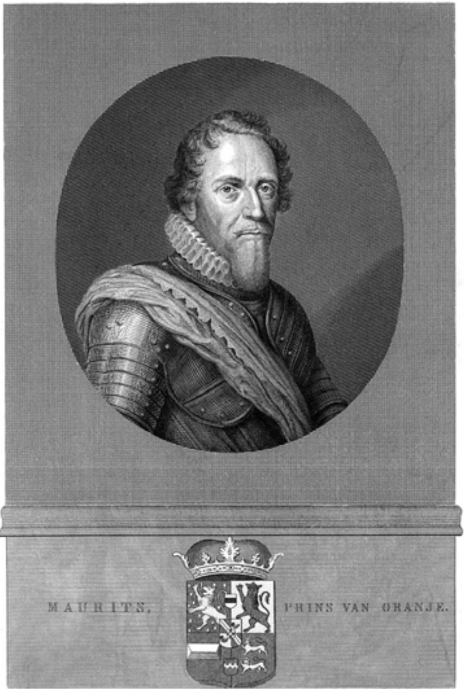
3. Portret van prins Maurits.