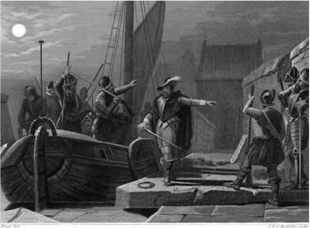
1. De verrassing van Breda.

hoge en lage adel weer achter het vaandel van Filips II te scharen. Zijn onverwachte dood in 1592 maakte een einde aan de Spaanse opmars.