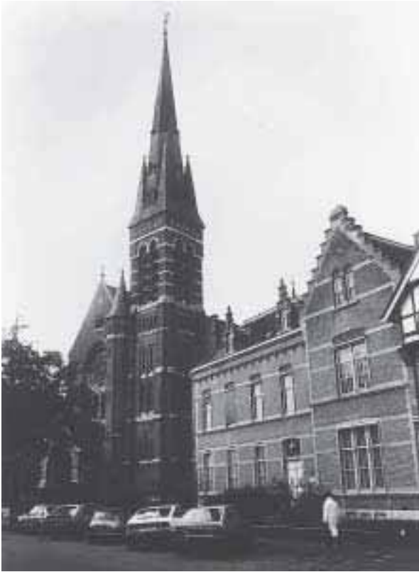
4. H. Hartkerk, Baronielaan.