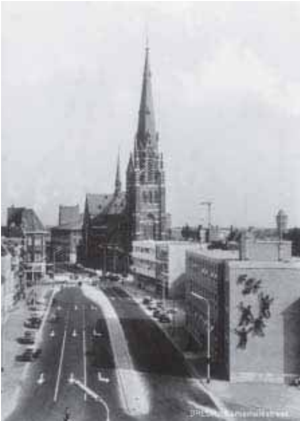
7. OLV Hemelvaartkerk in de Ginnekenstraat.