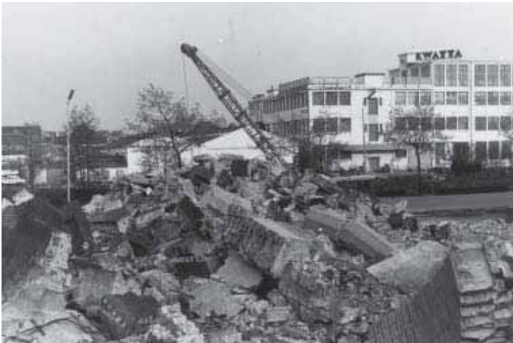
10. Afbraak H. Theresiakerk aan de Tramsingel, 1985.