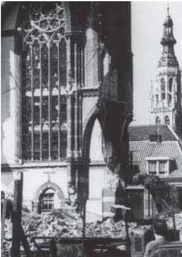
2. Afbraak van de OLV Hemelvaartkerk in de Ginnekenstraat (1967).