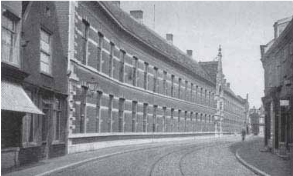
12. Gevel R.K. Gasthuis aan de Haagdijk, ca. 1940.

communies. De deelname was massaal. Hiervan getuigen de aantallen die plebaan Schrauwen noteert voor de missie van 1917. 51 Er waren 2650 biechtelingen in de Onze Lieve Vrouw ten Hemelopnemingparochie, 2321 in de Antoniuskerk, 2050 in de Heilig Hart, 2426 in de St. Joseph, 2340 in de Heilige Anna en 2177 bij de Pacujnen en 2476 in de kathedraal zelf.