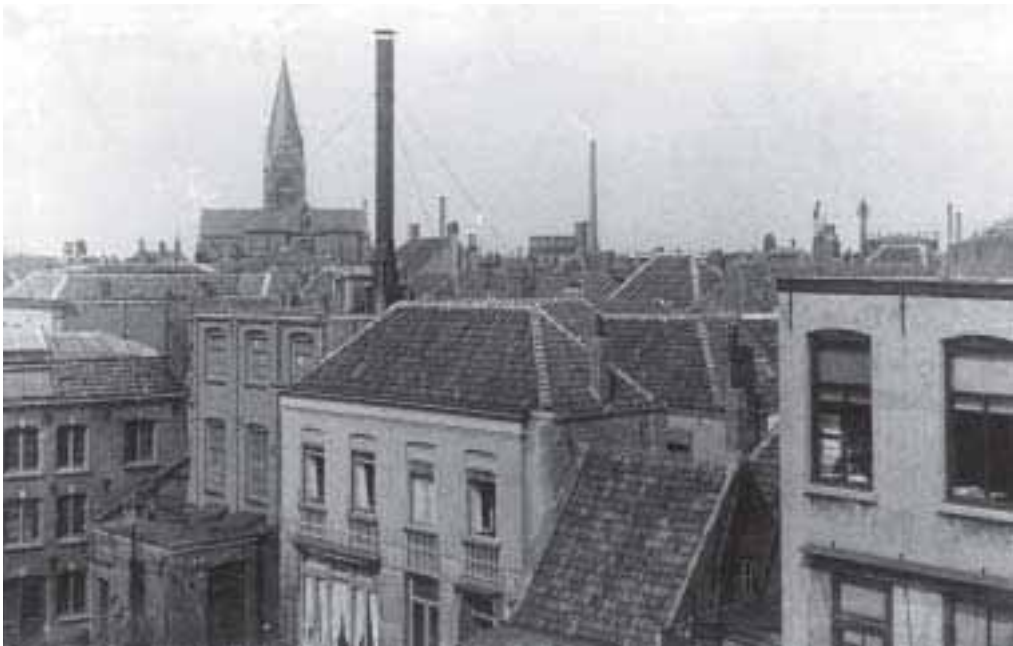
8. De Barbarakerk (Kathedraal) in het Bredase stadsbeeld, ca. 1930.