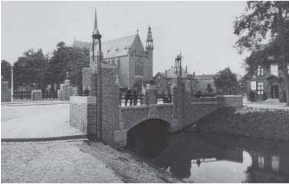
14. Haagpoortbrug met Sint Annakerk, ca. 1935.