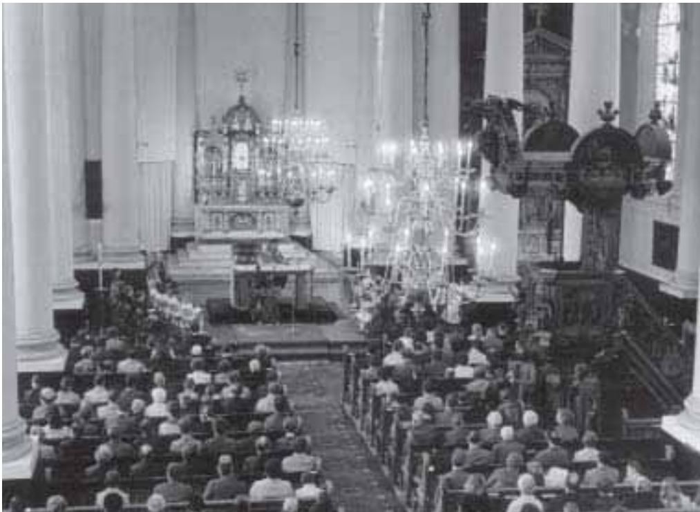
20. Interieur Anthoniuskerk.

hebben ook niet zo'n behoefte aan een I.P.V. Men wil de eigenheid van de eigen parochie niet verliezen. Met het oog op de voortgang van kerk en pastoraat komt het KASKI dan ook met voorstellen om de samenwerking te intensiveren. In de jaren negentig gaan de parochies op in grotere verbanden en komt er een fusie-beweging op gang. 122 In Breda-Zuid/Zuidoost fuseren de parochies aldaar per 1 januari 2000 tot de Jeruzalemparochie. Deze parochie beschikt momenteel over vier kerkgebouwen 123 Na deze fusie zijn er in Breda nog acht parochies. 124