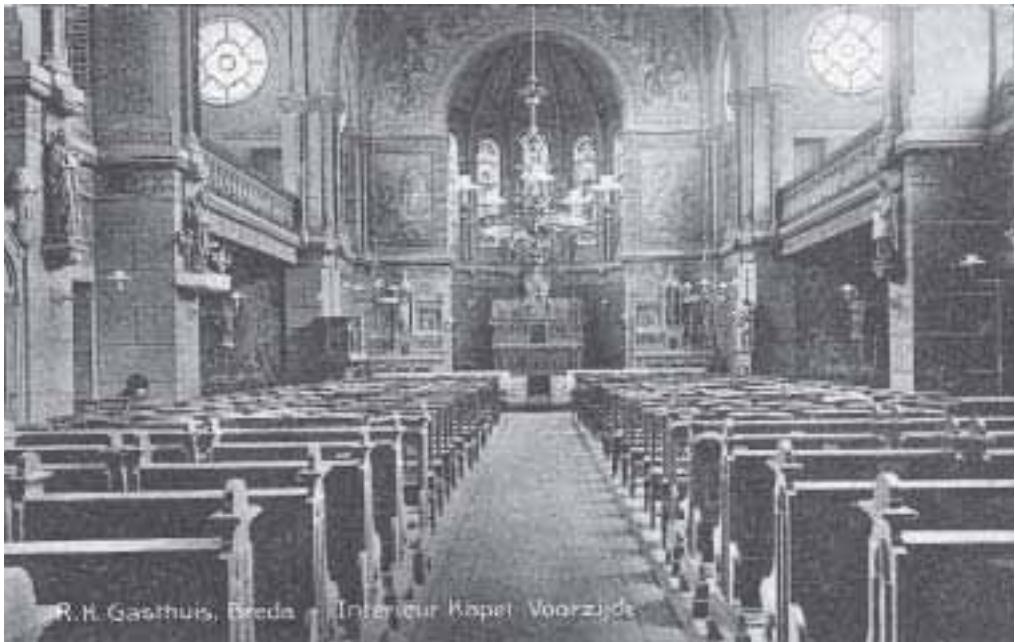
6. Interieur kapel R.K. Gasthuis, Breda.