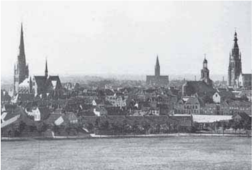
1. Gezicht op Breda vanaf de molen 'De Vierwinden', (Van Coothplein), ca.1914.

Op 30 september 1909 maakte G. de Hoog een foto van Breda. 1 De foto is genomen vanaf de Watertoren in Breda. Het is een fraai gezicht op de oude binnenstad. Deze wordt, naast de toren van de Grote Kerk gedomineerd door drie torens van katholieke kerken. Met de klok meedraaiend zie je de torens van de Onze Lieve Vrouw ten Hemelopneming (in de volksmond de Maria Hemelvaart of de kerk aan de Ginnekenstraat), de kathedraal van Sint Barbara en de Antoniuskerk.