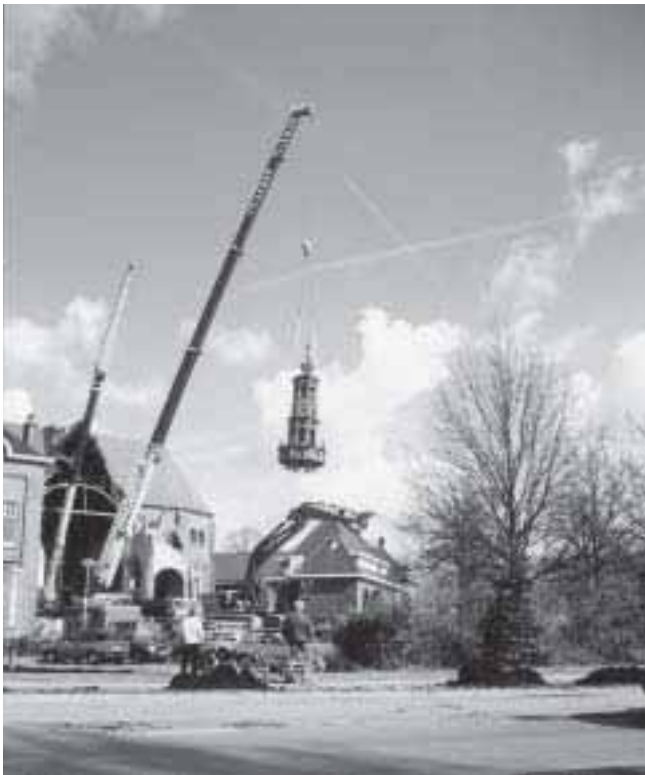
9. Afbraak van de kerk aan de Driesprong (1995).