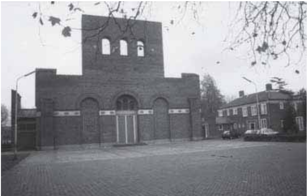
3. OLV Altijddurende Bijstand, Mgr. Nolensplein 1.