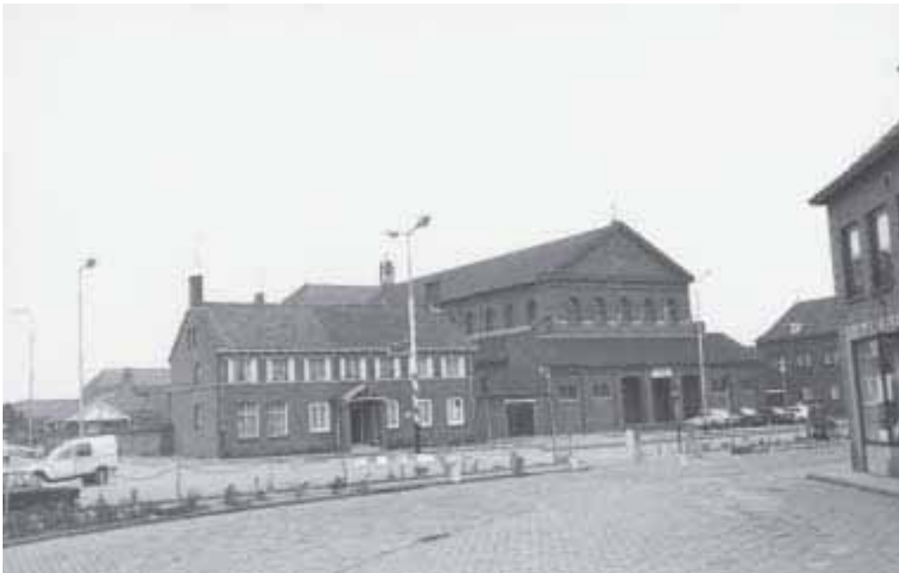
13. Fatimakerk aan de Fatimastraat (1949).

geving in Frankrijk, waren zij gevlucht en neergestreken in een huis aan de toenmalige Wilhelminastraat in Ginneken (nu Ginnekenweg 269). Zij stemden in met het verzoek. Hun klooster is achter de Sacramentskerk gebouwd. De Sacramentsparochie zou later ook bekend worden door het ziekentriduüm en het Sacramentskoor.