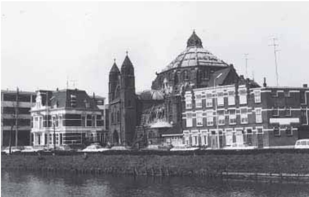
5. Theresiakerk, Tramsingel.