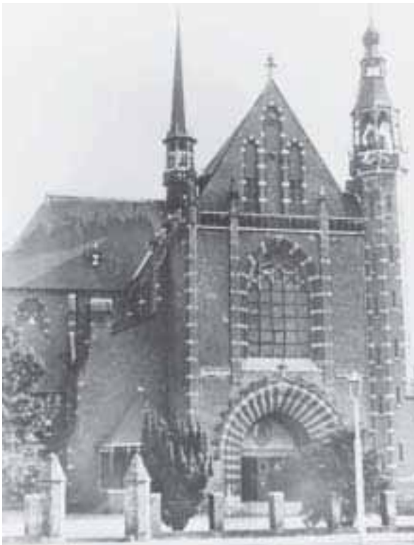
15. St. Annakerk aan de Haagweg.