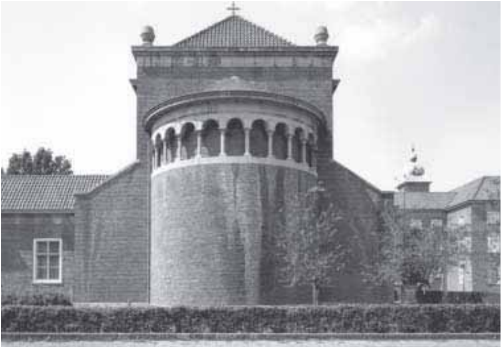
9. Absis van de kerk van het klooster Maria Mater Dei.