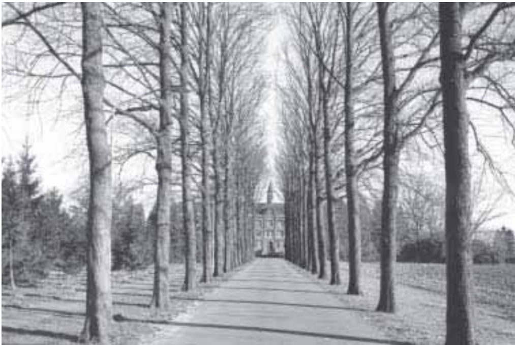
2. Sint Franciscus Xaverius aan het einde van de lange oprijlaan.

genstellingen, die hoofdzakelijk werden veroorzaakt door conflicten over geld en macht. Dit speelde vooral een rol waar het ging om priesterreligieuzen, die veel meer dan de broeders een bedreiging vormden voor de wereldheren. De broedercongregaties stonden, alleen al omdat hun stichter in de regel een pastoor of bisschop was, direct onder controle van de lokale of episcopale geestelijkheid. Met priesterreligieuzen, die veeleer alleen aan 'Rome' verantwoording hoefden af te leggen, lag dat geheel anders.