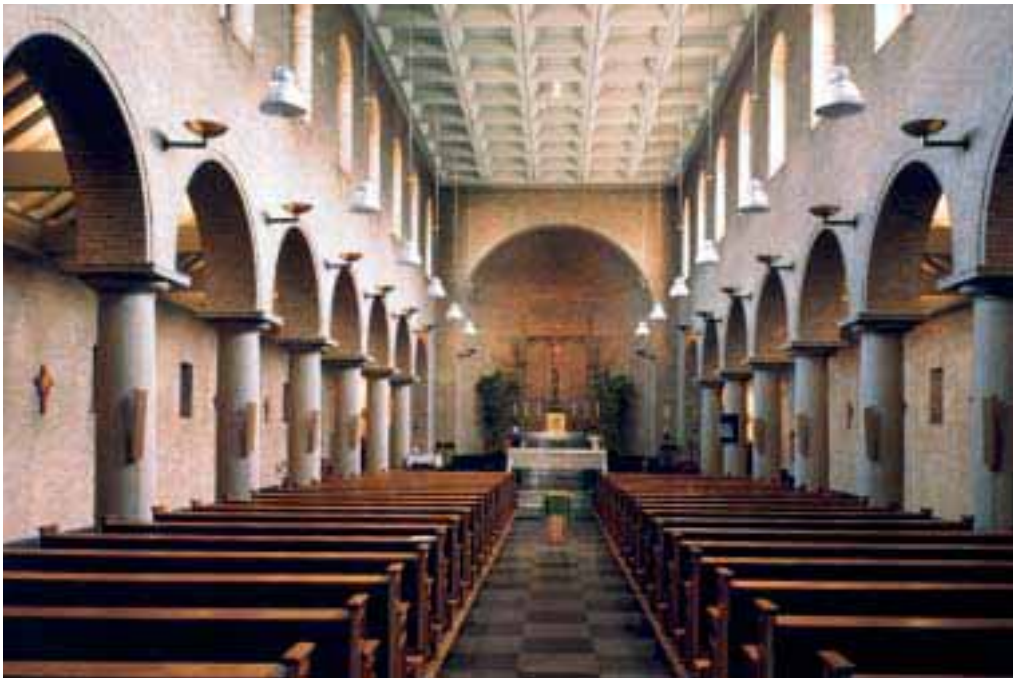
14. Kapel van Maria Mater Dei.

een aparte kamer, die soms in verbinding stond met de kapel of naast een aparte kleine kapel was gesitueerd.