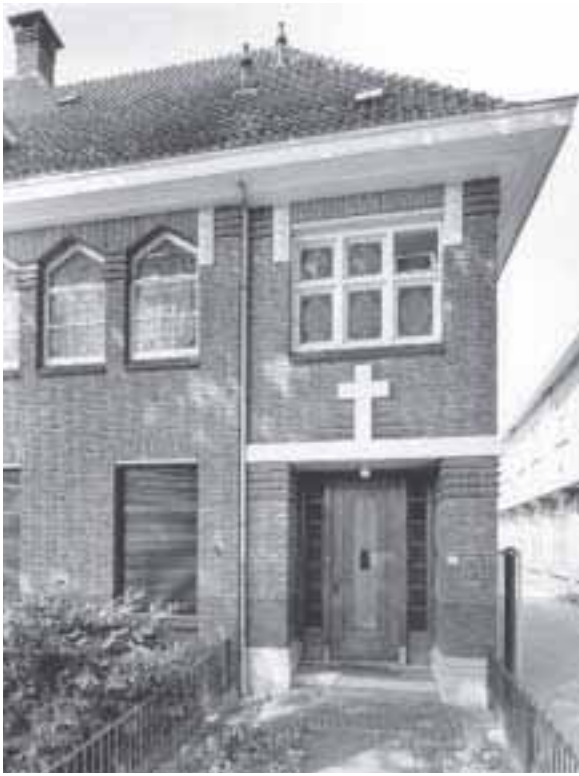
15. De zorgvuldig gedetailleerde entree van het klooster aan de Oosterhoutseweg te Breda.

De neogotische bouwtrant zou bijzonder hardnekkig blijken en tot ver in de twintigste eeuw worden toegepast. In een zeer sobere vorm wordt deze wel getypeerd als katholieke instituutstijl. 49 Hierbij vond een vermenging plaats van neogotische en neorenaissance-motieven in een vlakke gevelwand en een weinig sprekende bouwtypologie. Deze bouwtrant was algemeen en komt onder andere voor bij het klooster aan de Bredase Baronielaan (1901). Ook het klooster aan de Bredase Ceresstraat (1907) is hiervan een voorbeeld. Dit klooster heeft een villa-achtige opzet met neogotische geveldetails, bekroond met een ‘Hollandse’ trapgevel. Zowel broeder- als zustercongregaties – vrijwel alle franciscaans geïnspireerd en dus met een sobere inslag – bedienden zich hiervan. Het pas in 1918 geopende gesticht aan de Haagweg in Breda is het laatste voorbeeld van de neogotisch geïnspireerde bouwwerken.