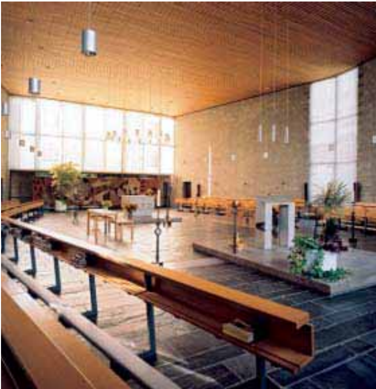
7. De kapel in het klooster aan de Meerten Verhoffstraat, samenkomen rond de Heer.

de paters-opleidingen waarschijnlijk met argwaan gade omdat zij verwachtten dat de bisschoppelijke seminaries hierdoor leerlingen zouden verliezen.