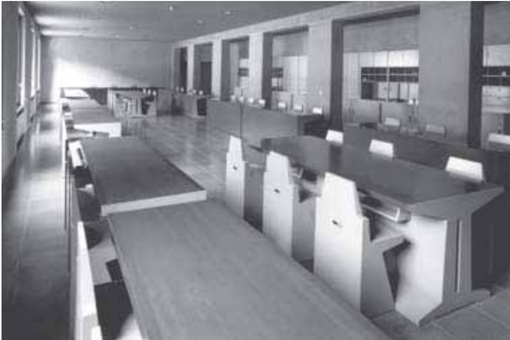
17. Refter van Onze-Lieve-Vrouweabdij, geheel in de trant van de Bosse school.

gens niet alleen functioneel om de bewoners onzichtbaar te maken. Hij kon ook dienstdoen om een schoolplein af te schermen. Dat was bijvoorbeeld het geval bij de franciscanessen te Liesbosch, die achter het klooster een speelplein hadden. 55