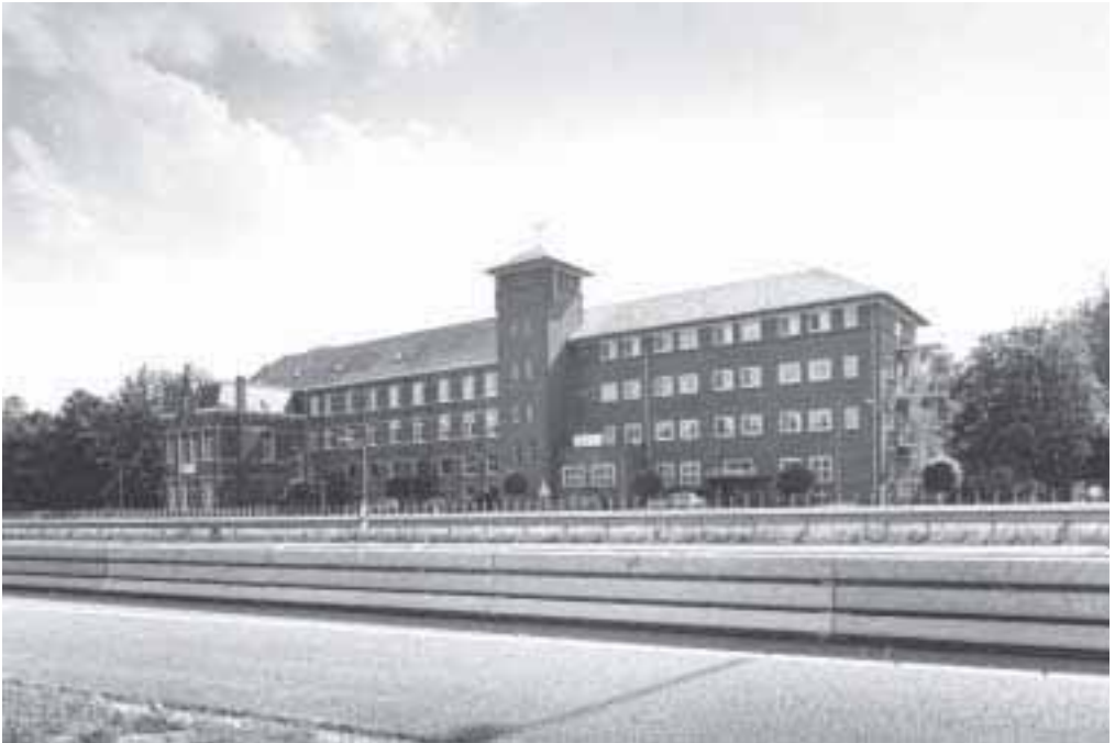
5. Huize Liesbosch, met links rectoraat, centraal de toren met waterreservoir.