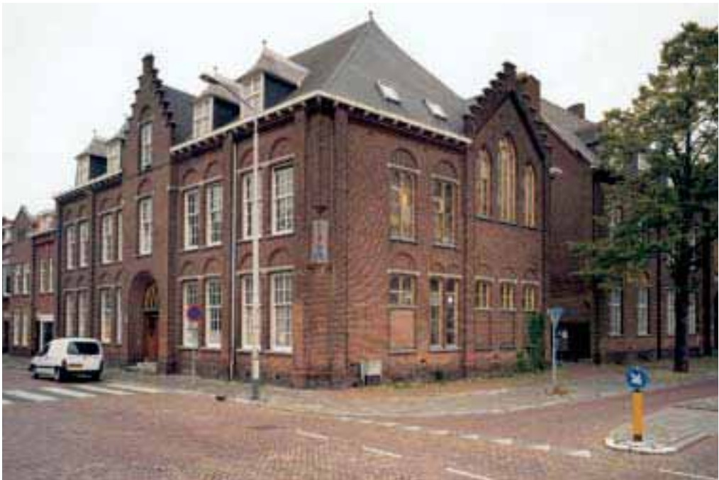
4. Klooster St. Anna aan de Bredase Haagweg.

den van Breda, net over de Belgische grens gelegen Meersel-Dreef hadden zij zich kunnen handhaven. In 1882 was een zelfstandige Nederlandse provincie van deze orde opgericht. Veel broeders woonden vóór de splitsing in Belgische kloosters en het was dus zaak het aantal Nederlandse huizen snel op peil te brengen om de repatrianten te kunnen herbergen. Breda was er daar één van. In 1952 stichtten de kapucijnen in Oosterhout hun seminarie, omdat dat te Langeweg in de oorlog was verwoest. Het seminarie was natuurlijk gericht op studie, omdat het in de loop der tijd toch nodig was gebleken daar meer aandacht aan te besteden. (Overigens niet alleen voor de kapucijnen, maar voor de hele Nederlandse kerkprovincie. Dit leidde onder andere tot de oprichting van de katholieke universiteit Nijmegen.)