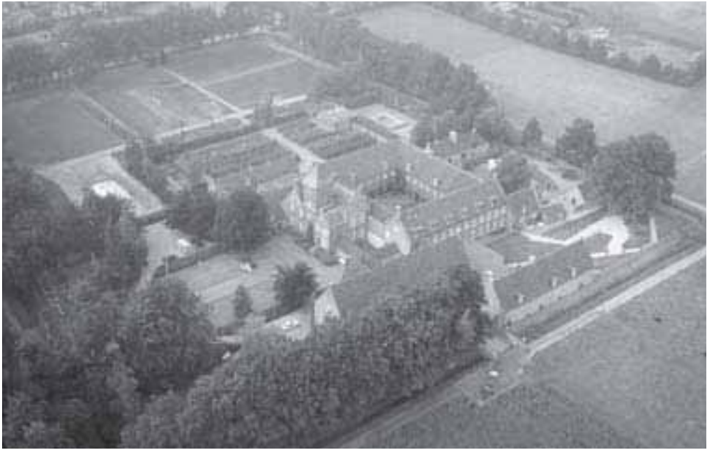
1. Sint-Catharinadal: beslotenheid door middel van grachten, muren en bomen.

Waar men uit is op een liefdevolle en hartelijke verzorging in zieke en oude dagen, daar denkt men het eerst aan Zusters. 7