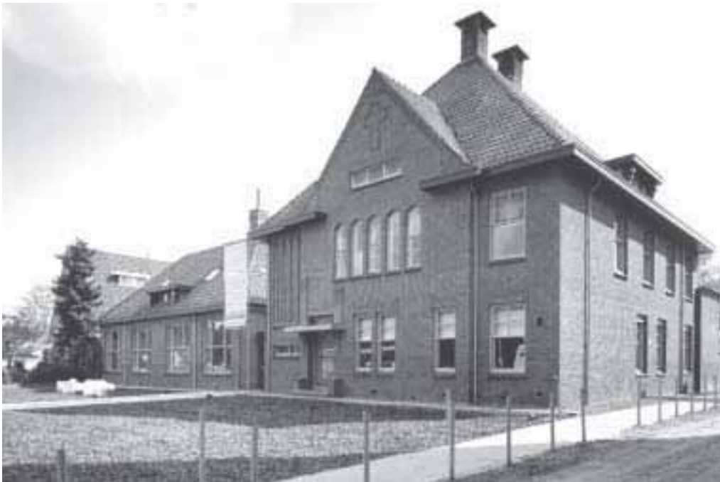
6. St. Alphonsusgesticht aan de Liesboslaan; links de school, rechts het klooster.