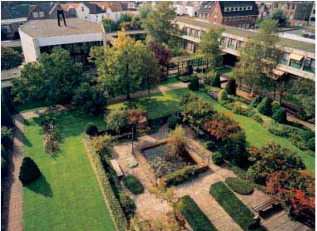
10. De tuin van het klooster aan de Meerten Verhoffstraat in Breda: rechthoeken en slingerende vormen.

bouw van zes bouwlagen. De binnenplaatsen worden omgeven door dit gebouw, lage zijvleugels en glazen gangen.