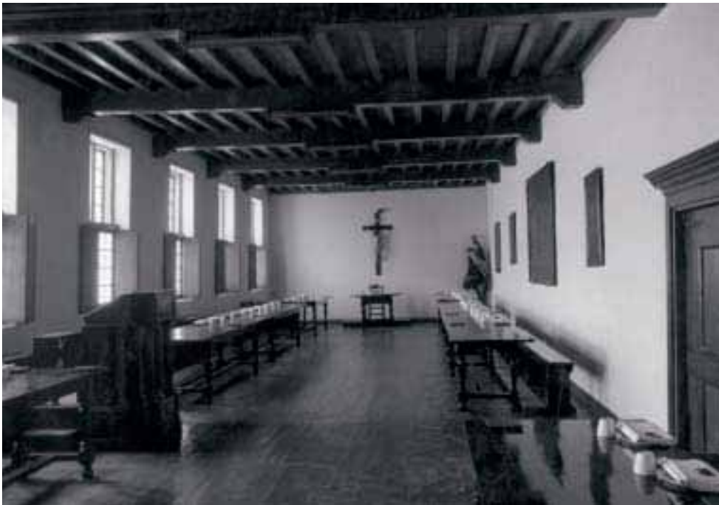
16. Refter van Sint-Catharinadal.

bied is de uitbreiding van het moederhuis van de franciscanessen van de H. Elisabeth in Breda (1961-1965). De vormentaal van de bijbehorende flat is weinig spectaculair. Maar de glazen gangen met hun ranke detaillering en de zorgvuldig ontworpen tuinen, met strakke én slingerende vormen, zijn fraai.