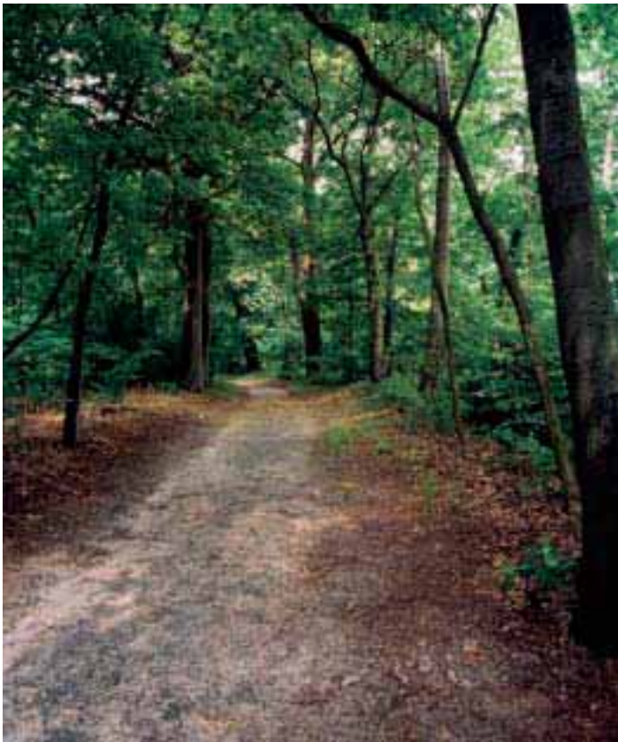
11. Een pad voor solitaire meditatie bij het klooster van de paters der H. Harten, Bavel.