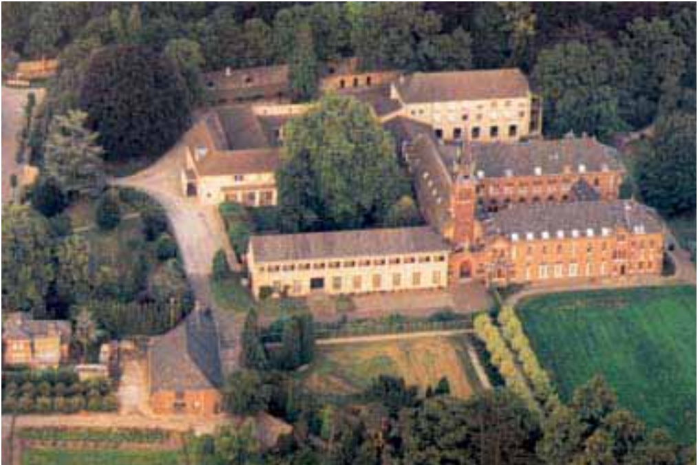
3. De Onze-Lieve-Vrouweabdij, een afwisseling van neogotiek en Bosseschool.

voorzien. Later onderwezen zij bijvoorbeeld de leraren van het in 1874 te Langeweg gestichte kapucijnenseminarie.