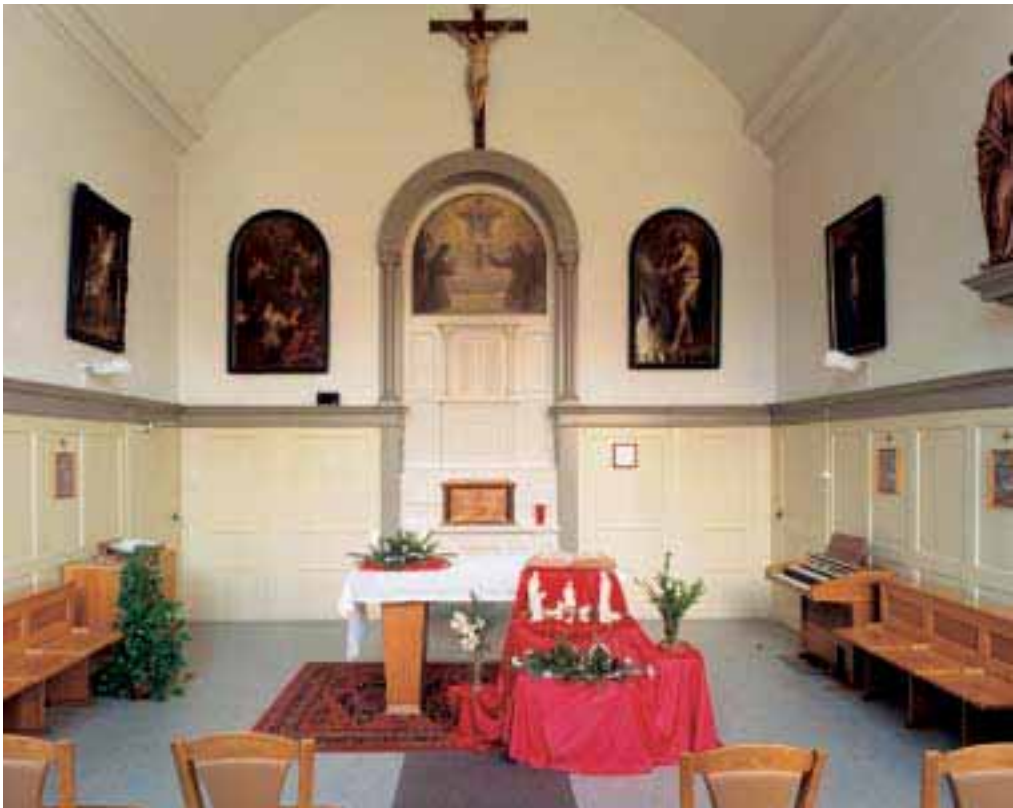
8. De Congregatiekapel van de Bredase kapucijnen.

slag kwam doordat de taken van religieuzen in onderwijs en ziekenzorg onder andere ten gevolge van de ‘mammoetwet’ door de overheid werden overgenomen, roepingen (vrijwel) stakten, uittredingen aan de orde van de dag waren en dientengevolge ontvolking en vergrijzing het ene klooster na het andere velden. Een veelzeggend voorbeeld: van de congregatie van Huijbergen is op dit ogenblik in heel Nederland nog slechts één broeder in het onderwijs werkzaam. De tot wasdom gekomen planten waren letterlijk uitgegroeid en de recente gedenkboeken zijn daarover meestal betrekkelijk berustend: het werk is gedaan of door anderen overgenomen, de spiritualiteit gaat op een andere manier door.