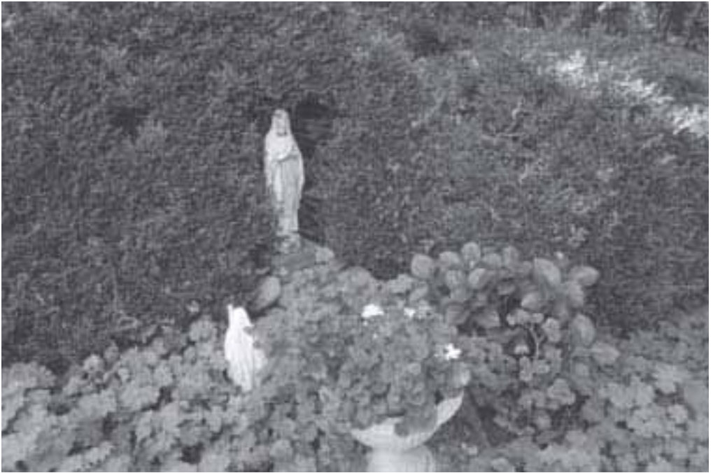
12. De miniscule 'grot' bij Huize Liesbosch.

franciscanessen Alles voor Allen hebben in hun moederhuis een enorme kerk met basilikale opzet, die er als apart gebouw zelfs in het grote complex uitspringt. In dit klooster was bovendien een aparte kapel voor novicen. De kapel kon niet altijd een prominente plek krijgen, ook al was deze wat groter, vanwege de indeling van het terrein: de franciscanessen aan de Bredase Nieuwstraat moesten de kapel kwijt op een klein binnenterrein. De congregatiekapel kent soms ook een voor buitenstaanders toegankelijk gedeelte, dat echter tenminste visueel gescheiden is van het 'koor' voor de religieuzen. Een strikte scheiding die zelfs oogcontact met bezoekers onmogelijk maakt, zoals bij de benedictinessen van de altijddurende aanbidding, is in het onderzoeksgebied niet meer aanwezig. Overigens kreeg de kapel als huis van God altijd een extra verzorgde architectuur, ook bij die congregaties die vanwege hun armoede-ideaal bij de andere kloostergebouwen minder 'uitpakten'. Immers: De bruid denkt aan de heerlijkheid van de Bruidegom: zij (...) vindt er haar vermaak in Zijn woning zo heerlijk mogelijk te maken. 40