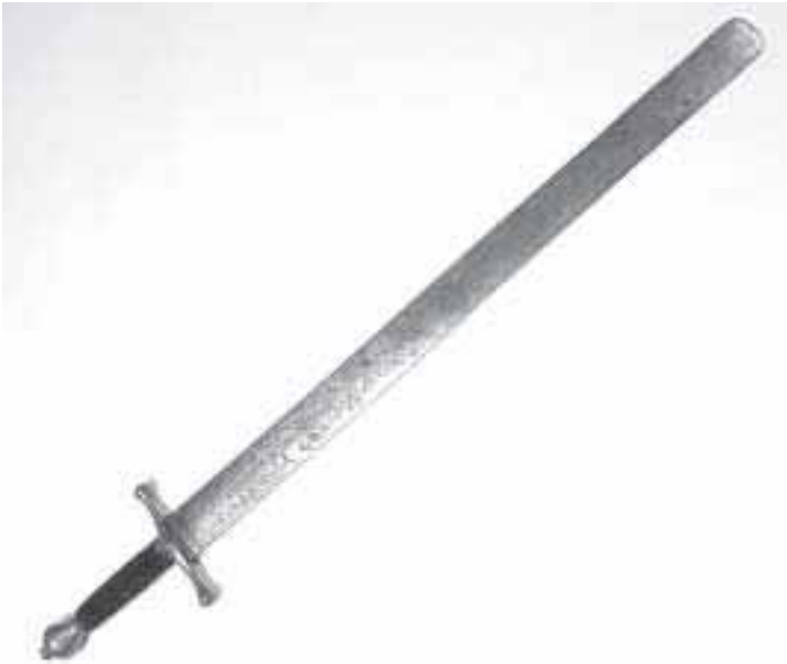
3. Zwaard van de scherprechter.

daenigh datter de dood navolge, den gedetineerden daar inne condemnerende mitsgaders in de costen en misen van de Justitie, alles ter moderatie van haar Ed. Wel Achtbare.