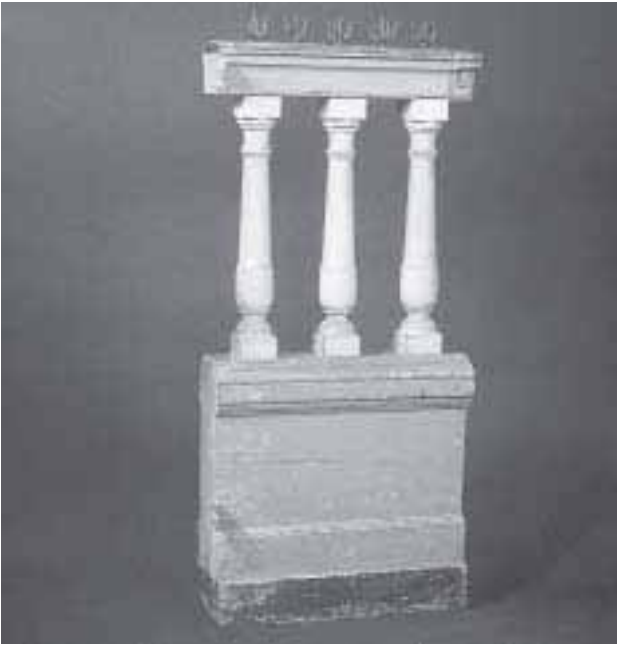
2. Hek van de vierschaar uit de achttiende eeuw.

En op de vraag of hij evenals de twee anderen zich aan het delict van valse munterij schuldig verklaarde werd het volgende antwoord in het protocol opgenomen: