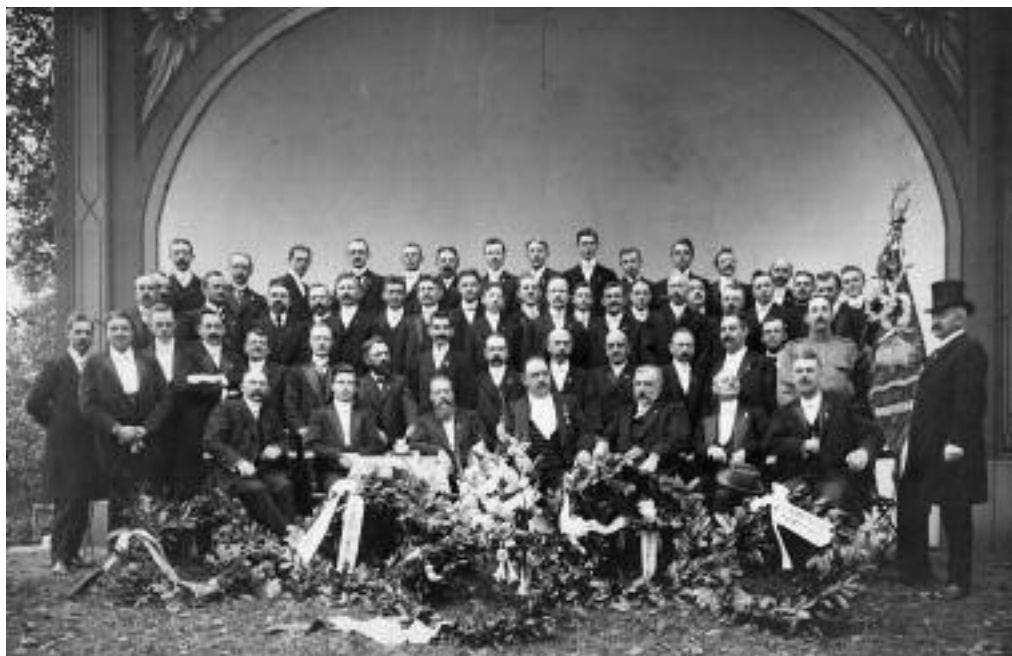
11. Viering 25-jarig bestaan in 1906 van de Liedertafel 'Aurora' in de tuin van de Sociëteit "De Eendragt".