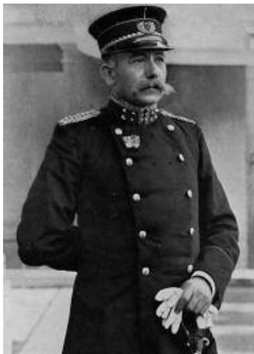
5. Luitenant-generaal W.H. van Terwisga.