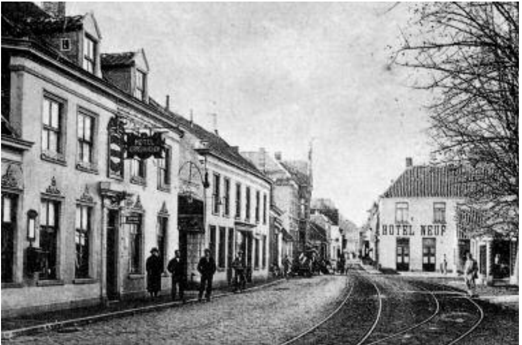
12. De Leijsenhoek met de hotels Koppelpaarden, Hildebrand en Hotel Neuf.