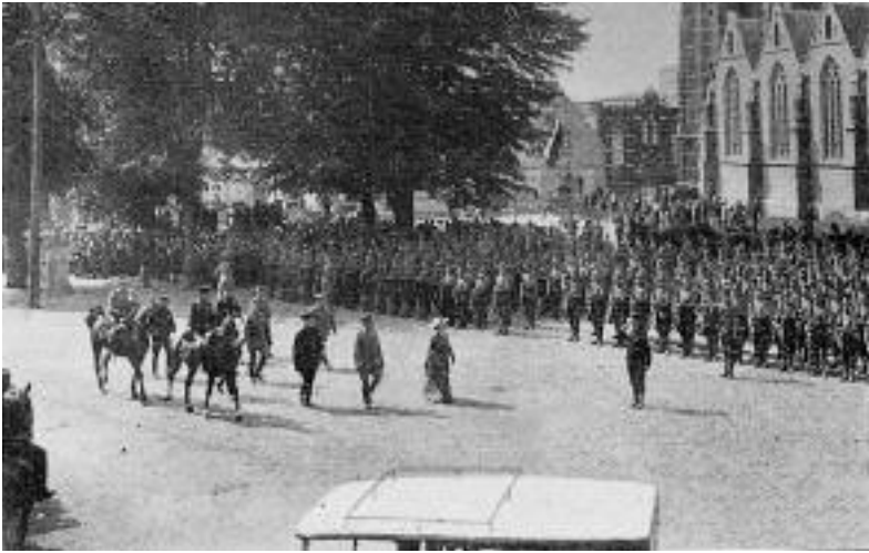
10 Inspectie op 17 mei 1917 door koningin Wilhelmina van de troepen van het Veldleger op de markt in Oosterhout.

Luitenant-generaal Van Terwisga herinnert zich: