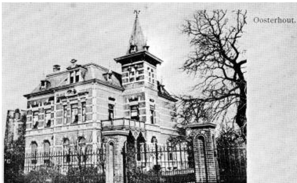
3. Villa Mathilda aan de Keiweg.

Naarmate het Duitse leger steeds meer in westelijke richting zijn aanval voortzette en Antwerpen bedreigd werd, lag een neutraliteitsschending in West-Brabant en Zeeland meer voor de hand. De troepen in West-Brabant werden daarom versterkt en op 6 oktober 1914 werd het hoofdkwartier van het Veldleger naar de villa Mathilda aan de Keiweg in Oosterhout verplaatst. 15