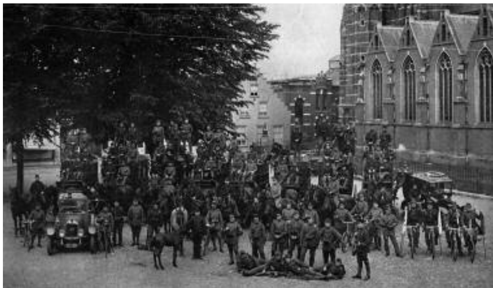
6. Afdeling Verbindingsdienst van het Veldleger op de Markt in Oosterhout (1915).