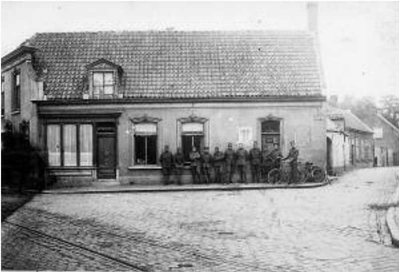
7 Militairen van de verbindingsafdeling van het hoofdkwartier van het Veldleger voor hun bureau op de hoek van de Leijshoek en de Leeuwenstraat.

Voor de communicatie was bij het hoofdkwartier de Verbindingsafdeling van het Veldleger ingedeeld. De eenheid verzorgde hoofdzakelijk de telefoon- en telegrafieverbindingen, waarbij nauw met de PTT samengewerkt werd. Zo waren de telegrafisten in het telegraafkantoor in de Arendstraat geplaatst.