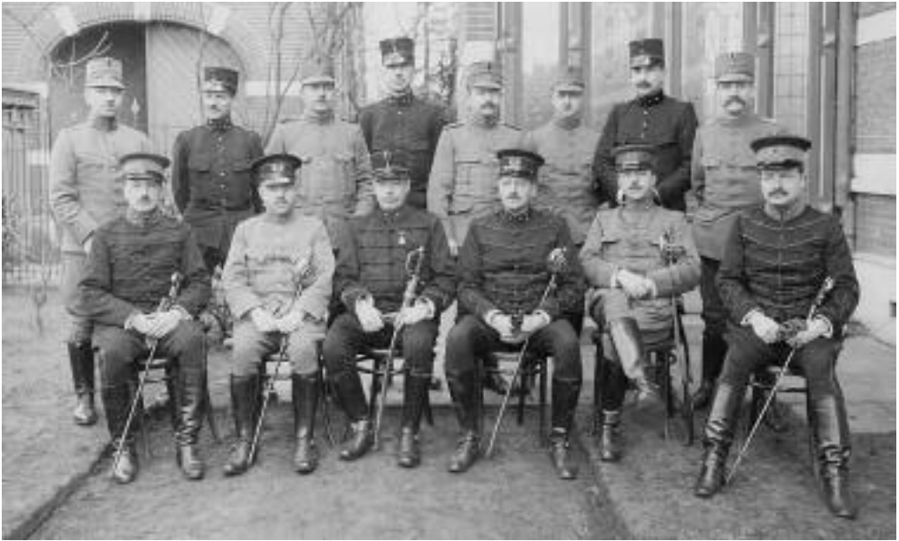
8. Stafofficieren van het hoofdkwartier van het Veldleger in Oosterhout (1915).

de dienstplichtige soldaten sinds de invoering in 1898 van de algemene en persoonlijke dienstplicht gestegen was. 40 Soldaten die onhandelbaar waren of zich misdroegen, liepen een grote kans naar gevechtseenheden te worden overgeplaatst en hun bevoorrechte posities te verliezen. Van ongeregeldheden bij de soldaten, zoals in Tilburg, was in Oosterhout niets te bespeuren. 41