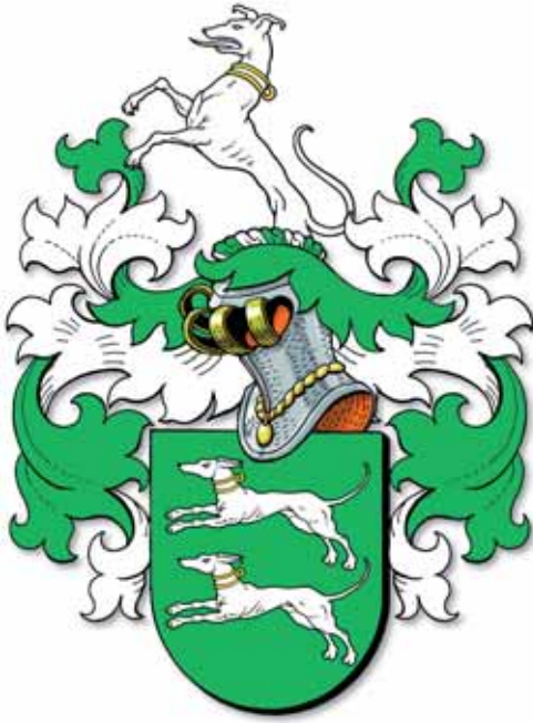
5. Wapen familie Snellen.

Snellen. 7 Vooral tijdens deze periode Snellen verscheen ook de naam Spijtenburg in officiële documenten.