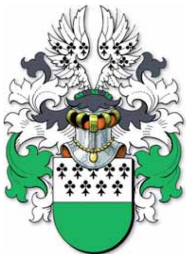
10. Wapen familie Van Broeckhuijsen.