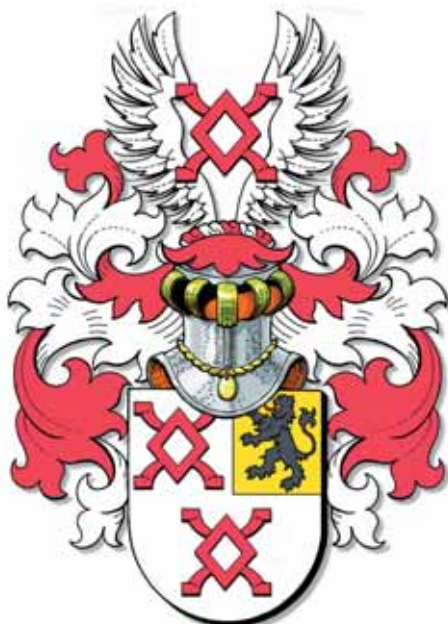
8. Wapen familie Van der Hoeven (Besojen).

Breda verhuisde en hier, evenals daarvoor zijn vader, enkele keren buitenburgemeester werd. Als buitenburgemeester was hij onder andere belast met de gemeentelijke financiën en verantwoordelijk voor personeelszaken zoals de benoemingen en het ontslag van dokters, schoolmeesters, stadsknechten, timmerlieden en metselaars. Hij behartigde ook de belangen van de stad buiten de stadsgrenzen.