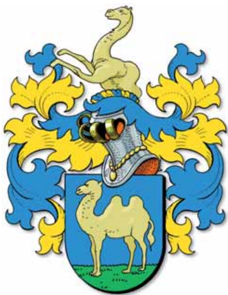
7. Wapen familie Hennequin.