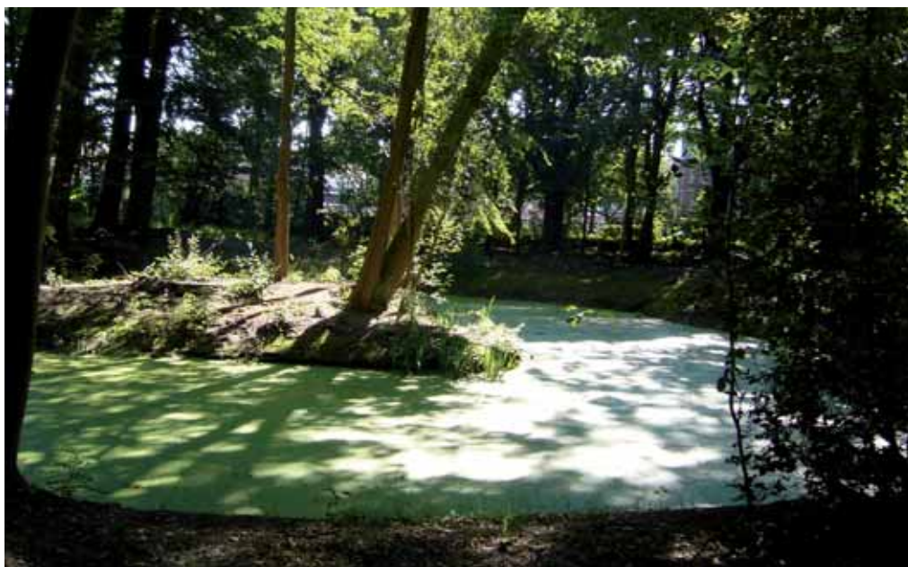
1. Foto van de vijver, de locatie van het vroegere Spijtenburg.

In deze bijdrage wordt echter het ware verhaal verteld over deze laatste bewoon-