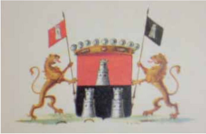
13. Wapen familie De/Van Dam.

Bartholomeus Snellen. 41 Genoemde broers waren de enige nog levende mannelijke nazaten van Hendrik Snellen, de enige broer van Willems vader, die nakomelingen had verwekt. 42 Zij waren dus in feite de meest rechthebbende erfgenamen in de mannelijke lijn. Ook nadat deze beiden zouden zijn overleden, moesten genoemd huis en landerijen in de familie Snellen blijven, zonder dat iets daarvan zou mogen worden verkocht. 43 Het huis en de bijbehorende plantage moesten in goede staat worden gebracht en onderhouden, aldus het testament. Van deze laatste bepaling zou niet veel terecht komen. Dat had alles te maken met een spraakmakende gebeurtenis in 1794.