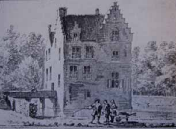
9. Het slotje Spijtenburg te Oosterhout.