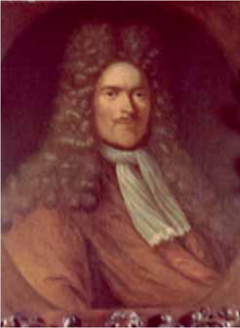
3. Schilderij Pieter Snellen.