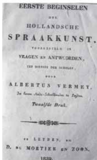
12. Enkele omslagen van leesboekjes die gebruikt werden op de lagere school voor meisjes op Sint-Catharinadal.

deren werden in de verhalen rechtstreeks aangesproken. Steeds weer kwam het erop neer dat geluk volgde op goed gedrag en ongeluk na slecht gedrag; wie slecht was zou ongelukkig worden, wie braaf was zou het goed gaan; wie niet wilde leren, had in de toekomst slechts armoede en ongeluk; vlijt en werkzaamheid zouden heil en geluk brengen. Dit was steeds de terugkerende strekking en boodschap aan de kinderen.