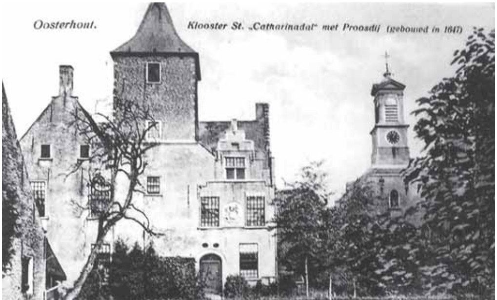
2. Situatie van Sint-Catharinadal in Oosterhout in de negentiende eeuw met vooraanzicht klooster, proosdij en waterstaatskerk.

Nederland zich, zowel onder koning Willem II als onder koning Willem III (1849 – 1890) tot een natie, waarin steeds meer burgers konden participeren in de democratie. Deze verdere liberalisering had ook tot gevolg dat Pius IX de bisschoppelijke hiërarchie in Nederland kon herstellen. Breda werd een bisdom in 1853 met als eerste bisschop mgr. J. van Hooijdonk (1782-1868).