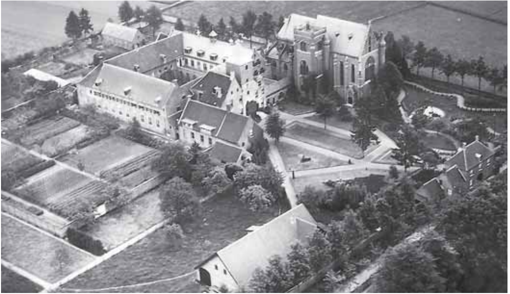
14. Luchtfoto van Sint-Catharinadal in de eerste helft van de twintigste eeuw. Op de voorgrond links de boerderij van het klooster en rechts het poortgebouw. In het midden de Proosdij, het Slot en de overige kloostergebouwen en rechts de in 1904 gebouwde neogotische kerk. Helemaal achterin het schoolgebouw.

gesticht van de zusters van liefde' om meisjes te onderwijzen. Deze weldoener overleed op 14 juli 1856 op 80-jarige leeftijd. Na zijn overlijden werd via een notariële akte alles verkocht aan Sint-Catharinadal voor het geringe bedrag van Bfrs. 6500,-.