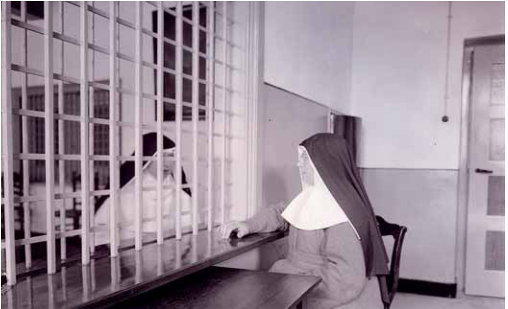
10. Het kloosterleven tot omstreeks 1960 binnen en buiten het Slot. Links de koornon achter de tralies van het Slot, rechts de buitenzuster in grijs habijt buiten het Slot. Op deze wijze verliep ook het lesgeven op de school omstreeks 1840.

dige opgave om goed onderwijs te verzorgen. Nationaal inspecteur Wijnbeek was in zijn rapport van 1835 best te spreken over de kwaliteit van het onderwijs: