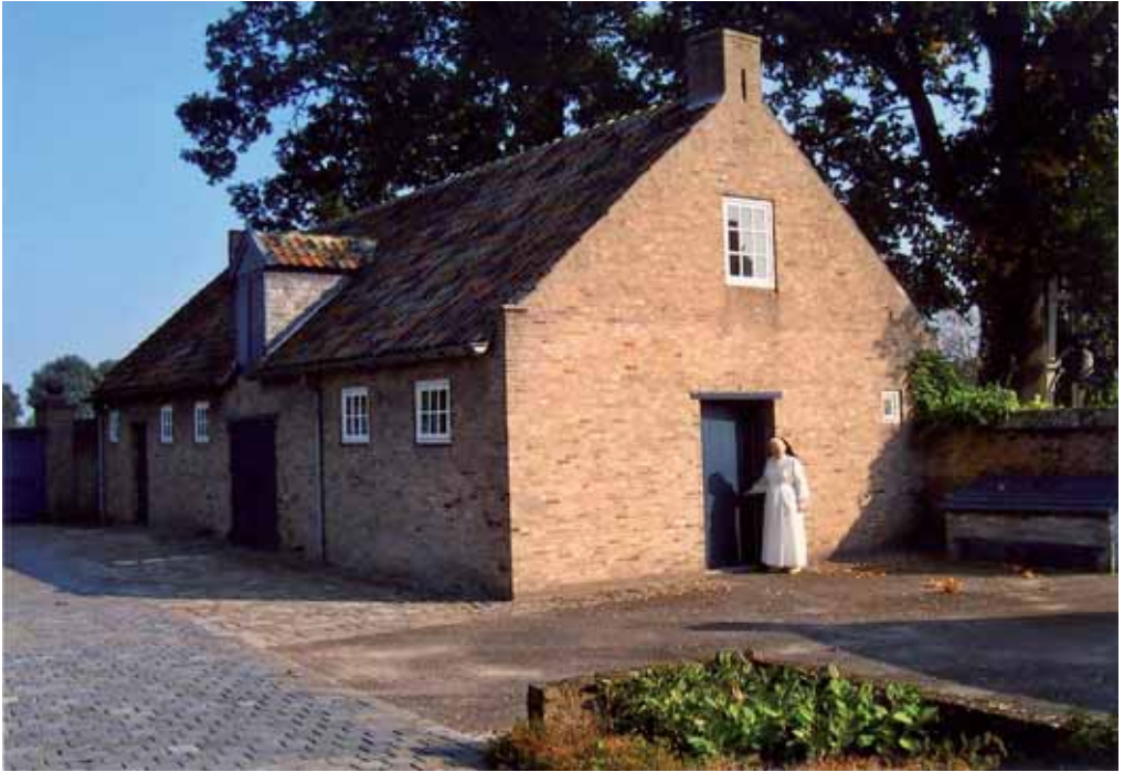
7. Het nieuwe schoolgebouw, gebouwd in 1826. Op de voorgrond zuster Mechtild.