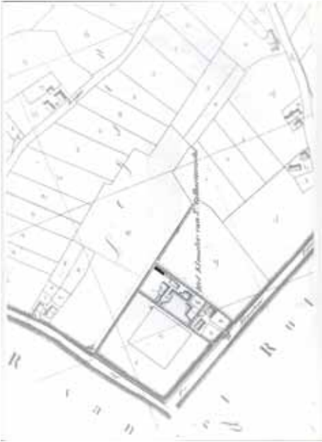
6. Eerste kadastrale kaart van 1812 met de kloostergebouwen en landerijen van Sint-Catharinadal.

Ook de provinciale schoolcommissie was zeer te spreken over deze nieuwbouw en keek hoopvol naar de toekomst. Wordt de verwachting verwezenlijkt dan zal dit gesticht een volgend jaar voor de mensenvriend een vertoning opleveren van welgevallige beschouwing , was het oordeel van de commissie. 44