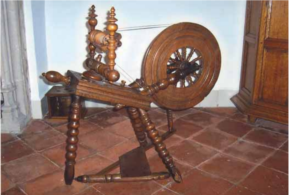
11. Een van de bewaard gebleven spinnewielen in het klooster Sint-Catharinadal.

den hebben, omdat zij tot de opheffing van de school in 1858 vanuit een kleine ruimte in het lokaal, afgescheiden van de kinderen met tralies, les heeft moeten geven.