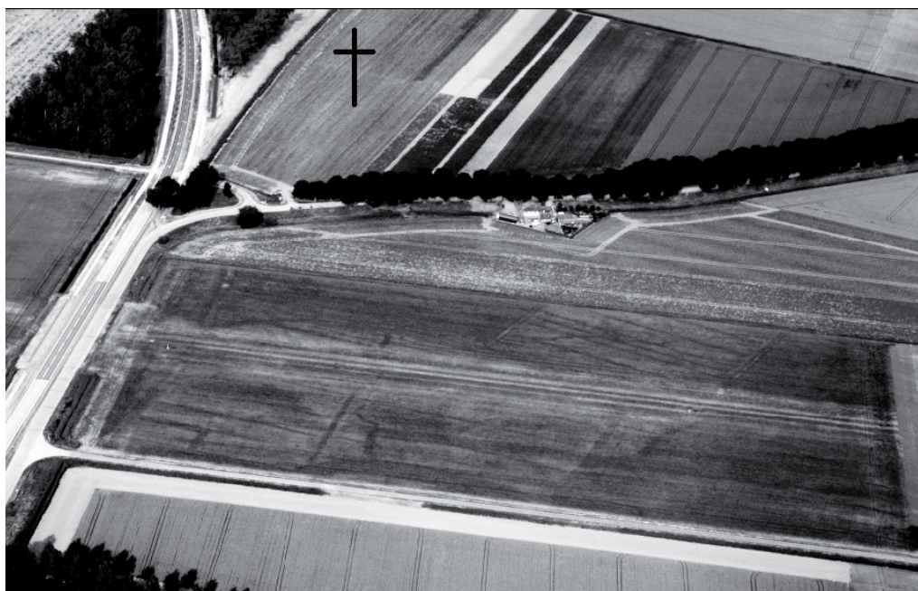
3. Luchtfoto uit 2005 van het in afbeelding 2 met "afb. 3" gemarkeerde perceel in de polder Bloemendaal, ten westen van het oude kerkhof. 12

De luchtfoto uit 2005 toont ons binnen de huidige polderverkaveling een fijnmazigere verkaveling van smalle stroken die schuin door de huidige percelen heenloopt (afbeelding 3). Dit fijnmazige verkavelingspatroon is niet terug te vinden op de kaart uit 1555 van de omstreeks 1546 bedijkte polder Bloemendaal en stamt dus