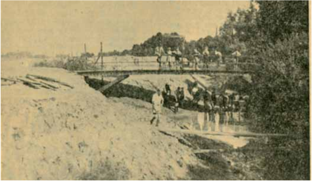
6. Het dempen van de oude Zaanmark bij het Boeimeerbruggetje om de aanleg van de Irenestraat mogelijk te maken.

(de latere Markendaalseweg) Deze kon aansluiten op de toekomstige Graaf Hendrik III laan via de nog aan te leggen Irenestraat.