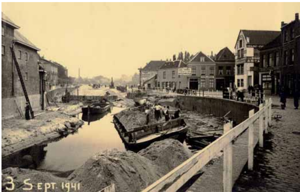
7. Het dempen van de Jan van Polanenkaede. in volle gang, 1941.

Eerder was deze categorie uitgesloten van de werkverschaffing omdat er voor hun vaders al te weinig werk was. De bezetter was er echter op uit zoveel mogelijk arbeidskrachten te mobiliseren om er zoveel mogelijk naar Duitsland te kunnen transporteren.