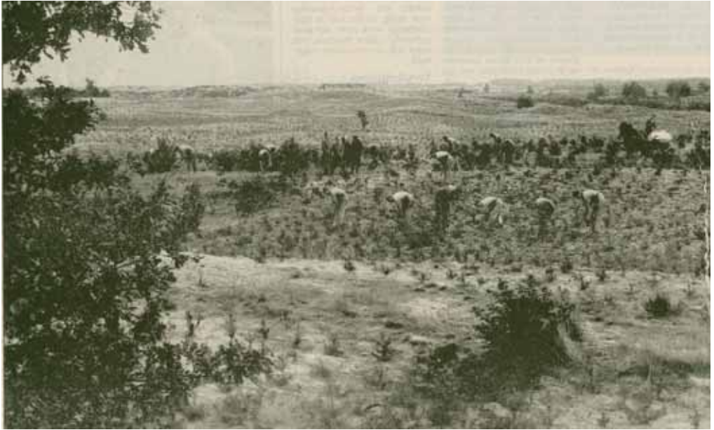
3. Werklozen plantten in de jaren dertig tienduizenden dennen in de Alphense Bergen.

Het vervoer bleek een probleem, een eigen autobus zou de oplossing zijn. De gemeente kocht een tweedehands bus geschikt voor 28 personen voor f 1000,- maar niet dan nadat er bij een ‘expert’ advies was ingewonnen. Desondanks bleek de aankoop een wrak. Nog geen jaar later keurde dezelfde expert, ir. A.L.J.M Fick, nu in zijn kwaliteit van keuringsinspecteur der autobussen in Noord-Brabant, de bus af. Een dure strop: aan reparatie was f 1741,32 uitgegeven en er kwam f 150,- terug van de autosloper. Het vervoer werd voortaan opgedragen aan een particuliere busonderneming. 16