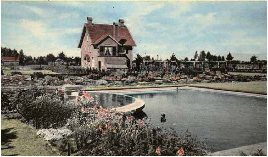
4. Het Brabantpark omstreeks 1940.

gemeente weinig kon veranderen aan het werkloosheidsvraagstuk. Hij herhaalde het standpunt dat grote werken uitvoeren de begroting te zeer zou belasten. Voor kredieten uit het Werkfonds gold hetzelfde: 'Het Werkfonds is ook geen Sinterklaas die presentjes uitdeelt'. 29