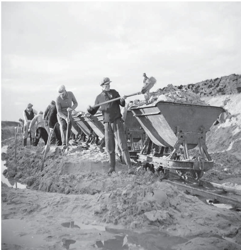
8. Arbeiders van de werkverschaffing graven het Defensiekanaal van de Peel-Raamstelling.

mandant van het IIIe legerkorps aan de Brabantse burgemeesters. Hij had geconstateerd dat er een buitenlander aan het graven was en daar was hij op tegen. Vreemdelingen of leden van extremistische partijen mochten niet op een militair werk tewerkgesteld worden. Per omgaande haalde de directeur van Maatschappelijk Hulpbetoon, waar in 1939 de steun en werkverschaffing waren ondergebracht, 33 Bredase mannen uit Mill terug. Hem was, na overleg met de politie, gebleken dat zij bij extremistische partijen waren aangesloten of 'met deze partijen uitermate sympathiseren'. Zij gingen naar het project de Zonzeelse polder in Terheijden. 54