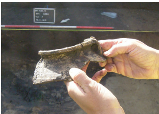
2. Fragment van een Pingsdorf tuytput, gevonden in een waterput Datering: ca. 900-1200 na Chr. (Erfgoed Breda)

Voorafgaand aan de realisatie van het woningbouwproject “Op Dreef in Princenhage”, gelegen tussen de Dreef, Postillonstraat en Gielis Beijsstraat, is in september 2015 een archeologische opgraving uitgevoerd. Tijdens dit archeologisch onderzoek aan de Dreef is een middeleeuwse vindplaats aangetroffen. De archeologen van de gemeente Breda onderzochten er vele greppels, waterputten, en paal-sporen - sporen van gebouwen. Ook troffen zij voorwerpen van hout aan, metaalslakken die duiden op metaalproductie, aardewerkscher-ven, en grote stukken tufsteen gebruikt als maalstenen. Al deze sporen en vondsten duiden erop dat op deze locatie tijdens en na de middeleeuwen in verschillende fasen gewoond en geleefd is.