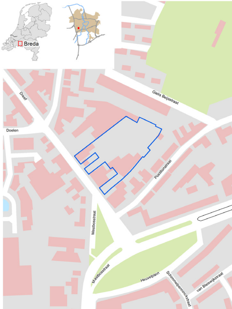
1. Plangebied archeologisch onderzoek Op Dreef in Princenhage.