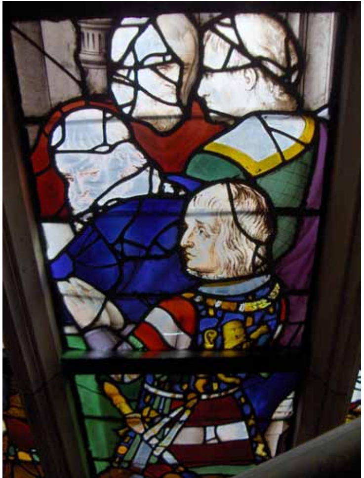
12 Detail uit raam in de Onze-Lieve-Vrouwekathedraal in Antwerpen met een knielende Engelbrecht II. (Kathedraal Antwerpen.).

Nassau zijn wat gestileerd afgebeeld in hun wapenuitrusting, ieder met zijn wapenschild. De personen staan voor een groot raam of op een open galerij met een doorkijk op een stad (Breda bij beide Engelbrechts, Dillenburg of Siegen bij Jan IV?) of een kasteel (mogelijk dat in Breda, bij Hendrik III).