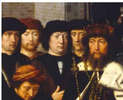
8 Engelbrecht II van Nassau als toeschouwer bij de terechtstelling van Sisamnes. Detail van afbeelding 7.

Verder is er nog een portret van Engelbert in een boek over de ridders van het Gulden Vlies in de Koninklijke Bibliotheek in Den Haag waarin alle ridders van deze orde staan afgebeeld in het habijt, behorend bij de orde, en met hun wapenschilden. 13