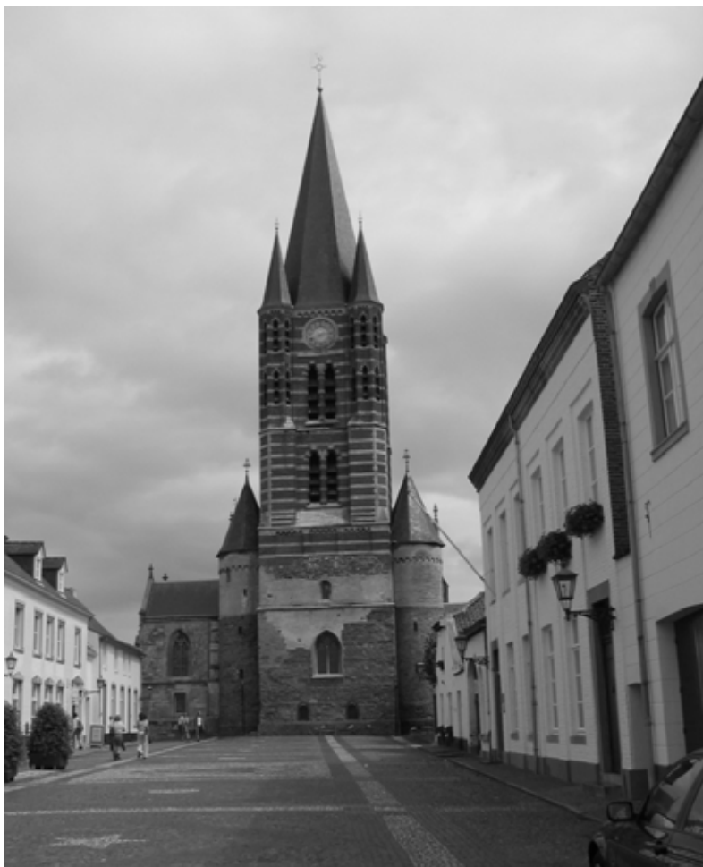
2. Voorzijde met toren van de abdijkerk van Thorn. Het 'witte stadje' is nog steeds de moeite van een bezoek waard.

De drie oorkonden, maar met name die van 992, beschermen het bezit van twee kloosters, Nijvel en Thorn, en leggen in grote lijnen vast waaruit dit bestaat. De heren van het land van Strijen moeten ervoor zorgen dat niemand dit bezit ontvreemdt. Dat is hun plicht als goed christen.