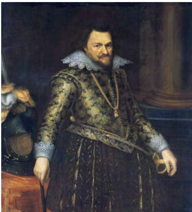
3. Baron Filips Willem (1554-1618), de katholieke zoon van Willem van Oranje en Anna van Buren.