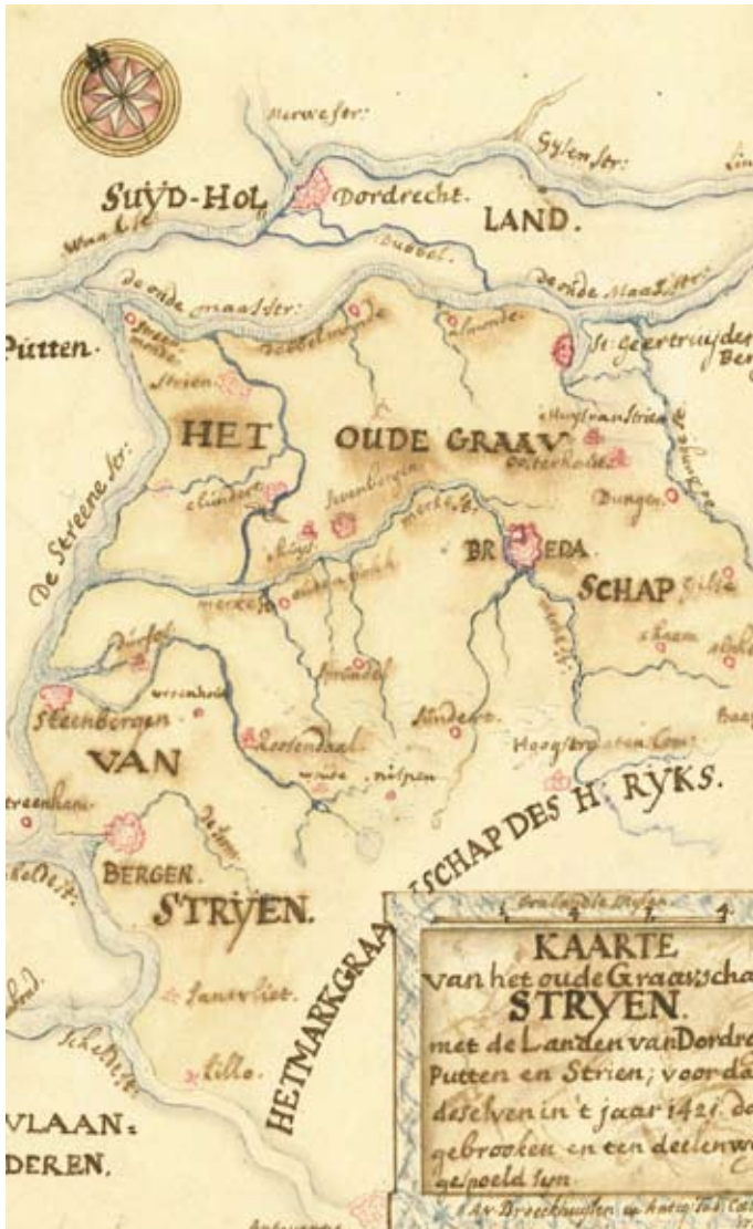
5. Kaart met reconstructie van het graafschap Strijen zoals dat er in 1421 uit gezien zou hebben. Kaart gemaakt door kolonel Adam van Broeckhuysen rond 1740. (BHIC, Coll. Cuypers van Velthoven inv. nr. 510)

met Breda was nog niet zo'n slecht idee omdat in 1300 een heer van Breda huwde met een dochter van de heer van Strijen. De heerlijkheid Strijen heeft echt bestaan als een vrije heerlijkheid en strekte zich naar het zuiden uit tot en met Zevenbergen dat grensde aan het land van Breda. In Oosterhout bouwden de heren van Strijen kort na 1288 een burcht, die er rond 1600 nog steeds stond en met zijn hoge torens al vanaf Dordrecht te zien was. Deze burcht, die tot de verbeelding sprak, was bezit van de baronnen van Breda. 62