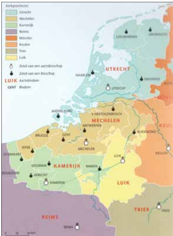
2 Kaart van de aartsbisdommen en bisdommen in de Nederlanden na door de paus goedgekeurde herindeling in het jaar 1559. (Bosatlas van de geschiedenis van Nederland, (2011) p. 190. Noordhoff uitgevers).

Noord-Brabant werd met de omgeving van Geertruidenberg toebedeeld aan het nieuwe bisdom 's-Hertogenbosch.