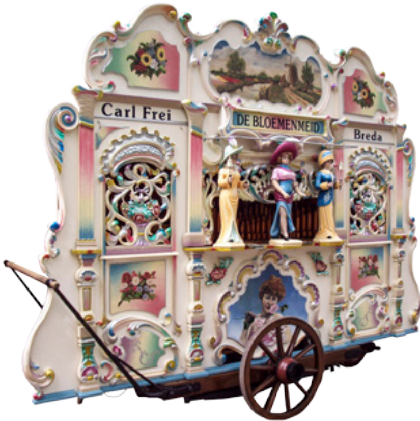
27. Orgel 'De Bloemenmeid'. Dit orgel is in 1934 ingrijpend door Carl Frei aangepast.

Om terug te komen op de verbouw van orgels door Carl Frei: moge één voorbeeld, de bewogen bestaansgeschiedenis van orgel 'De Bloemenmeid', volstaan.