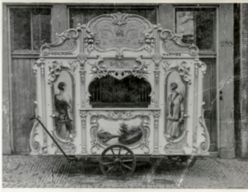
25. Orgel 'De Kleine Radio' gebouwd door Carl Frei senior in 1929 te Breda. De foto is kort na levering genomen voor de orgelloods van de firma Möhlmann-Warnies, Brouwersgracht 258 in Amsterdam.