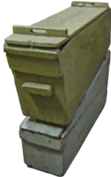
12. Kisten met orgelboeken behorend bij het Carl Frei-kermisorgel uit 1934.

Dit orgel dat altijd in een kermisattractie heeft gestaan, heeft zoals de meeste kermisorgels, geen naam.