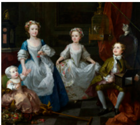
2. William Hogarth. The Graham children (1742). De jongen op de stoel speelt op een orgeltje en begeleidt het fluitende vogeltje in de kooi (National Gallery, Londen).

Zij ontstaan in de jaren 1720-1730 en nemen in de achttiende eeuw een vlucht. 2 Het zijn zogeheten cilinderorgeltjes. In een cilinder worden acht muziekpatronen gestoken die door het horizontaal verschuiven van deze cilinder ten gehore worden gebracht. Het zijn eenstemmige melodietjes, 'airs' geheten, voortgebracht door tien tinnen fluitjes.