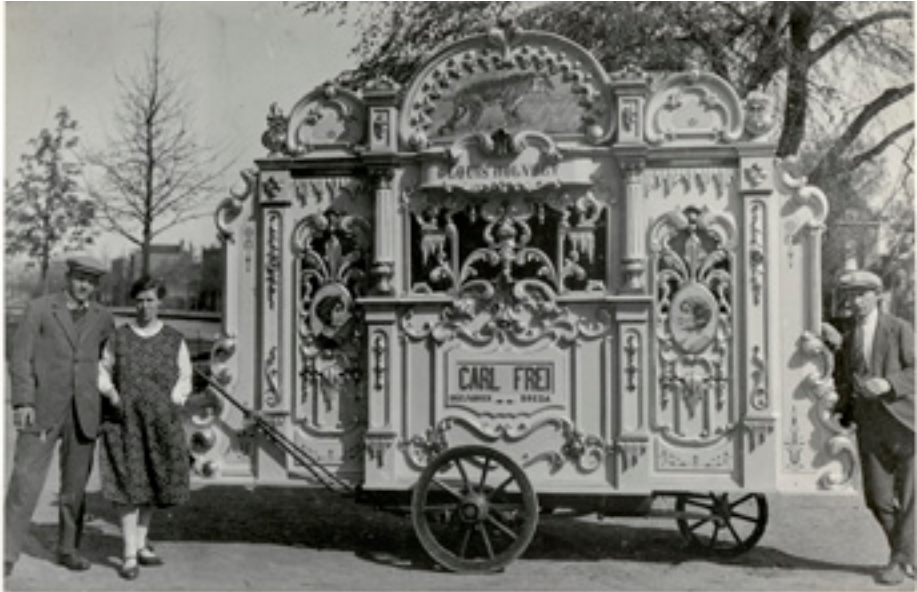
26. Orgel 'De Pelikaan' in 1929 verbouwd door Carl Frei senior in Breda, jaren '30 vorige eeuw.

De twee bekendste zijn 'De Negentiger' en 'De Cementmolen'. 90 'De Negentiger' uit 1930 begint zijn carrière in Rotterdam. 91 De gespeelde boeken zijn enorm populair zoals de wals 'Noël', 'Harmonica Jim', en de tango 'Ole Guapa' van 'Malando' Maasland. 92 'De Cementmolen' die een bewogen geschiedenis kent, is genoemd naar het grote wiel met de rechte spaken. 93 Andere Frei-orgels die uit deze periode stammen zijn 'De Vijf Beelden', 'De Blauwe Trom', 'De Vliegende Vleugel' en 'De Sik'. 94