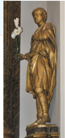
6a-c. Preekstoel in Oudkatholieke kerk te Den Haag ontworpen door Jan Baptist de Xavery in 1729. In zelfde kerk staan twee beelden van Jan Claudius de Cock: Maria en Josef.