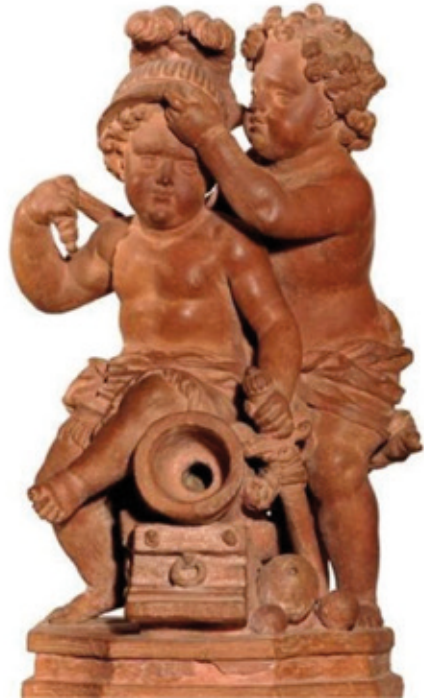
8. Terracotta beeldje van Oorlog en Vrede gemaakt door Jan Claudius de Cock (Stedelijk Museum Breda)

Terecht is de vraag opgeworpen of dit beeld de oorlog of de vrede voorstelt. 48 Het is namelijk niet geheel duidelijk of de ene putto de oorlogshelm bij de andere putto op- of afzet. Verschillende argumenten wijzen in de richting van de vrede. Het eerste argument is dat het mortier zichtbaar niet geladen is. De kogels liggen naast dit wapenstuk. Het tweede argument is dat het jongetje de sabel niet heeft getrokken om de strijd aan te gaan en ook niet op het punt staat om naar dit wapen te grijpen. De zittende pose op het mortier en de ontspannen en ongedwongen blik in de ogen van de putto maken eveneens geen strijdbare indruk. Ten slotte bevinden enkele vingers van de hand van de staande putto, die evenmin gespannen lijkt te zijn, zich onder de helm. Deze ondersteunende houding ligt meer voor de hand bij het optillen dan bij het plaatsen van een helm.