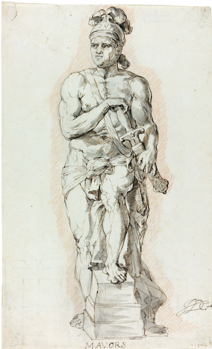
1. Tekening van een beeld van de god Mars door Jan Claudius de Cock (Herzog Anton Ulrich-Museum in Braunschweig, Kupferstichkabinett, Z1415 recto)