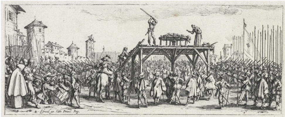
6. Executie door radbraking. Prent van Jacques Callot uit 1633. (Rijksmuseum, RP-P-OB-20.665.0)

zwaard werd geëxecuteerd. Bij deze poena ordinaria gladii – de ‘gewone straf van het zwaard’ – werd de veroordeelde door de beul met diens scherprechterszwaard het hoofd afgeslagen. Eenzelfde lot was een moordenaar beschoren, tenzij de moordaanslag bijzonder hatelijk werd geacht, in welk geval de dader door radbraking kon worden terechtgesteld. In dat geval werd hij op een wagenwiel of een radbraakkruis vastgebonden, waarna de beul hem met een ijzeren of houten staaf de beenderen stuksloeg. Het hoofd van de veroordeelde werd vervolgens met een bijl afgeslagen en op een pin tentoongesteld naast het ontzielde lichaam.