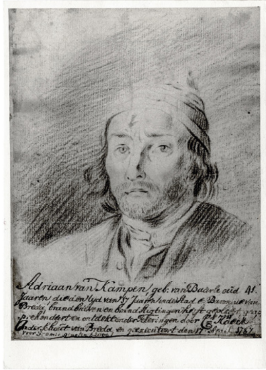
7. Adriaan van Campen, geradbraakt te Breda op 17 april 1787 wegens afpersing, brandstichting en geweldpleging. (collectie Stadsarchief Breda, id.nr. 19750278)

Beziet men de straffen die in de zeventiende en achttiende eeuw aan Brabantse delinquenten zijn opgelegd, dan kan men een zekere tendens tot humanisering van de strafrechtspraktijk waarnemen. 18 Eenzelfde meer humane opstelling van de ambtenaren van justitie treft men in deze eeuwen aan ten aanzien van het verschijnsel zelfdoding. Men maakte voortaan een onderscheid tussen verwijtbare en verontschuldigbare zelfdoding. In het eerste geval was nog steeds de oude sleepstraf op zijn plaats, maar in het tweede geval, waarin iemand zichzelf had gedood omdat hij bijvoorbeeld ongeneeslijk ziek of