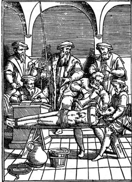
5. Het volgieten met water als martelmethode. (Joos de Damhouder, Practijcke ende handbouck in criminele zaecke , editie 1555, heruitgegeven door J. Dauwe en J. Monballyu, Roeselare 1981)

Volgens vaste gewoonte in de Nederlanden mocht de verdachte tot drie keer toe aan een scherpe examinatie worden onderworpen. Wist hij alle pijnigingen te doorstaan zonder een bekentenis af te leggen, dan moest de gerechts-officier zijn bewijs op een andere wijze trachten rond te krijgen. Bekende de verdachte daarentegen de hem ten laste gelegde feiten, dan moest hij deze bekentenis buiten het zicht van de beul en zijn instrumenten herhalen. Een op de pijnbank afgedwongen bekentenis die daarna pijnloos was bevestigd, gold als een vrijwillig afgelegde bekentenis en had daarmee een volledige bewijskracht.