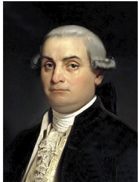
8. Strafrechtshervormer Cesare Bonesana markies de Beccaria (1738-1794).

De ideeën van deze Italiaanse strafrechtshervormer vonden in de meeste Europese landen in meerdere of mindere mate navolging. In de negentiende eeuw werd het strafrecht van Nederland – de eenheidsstaat waarvan Brabant één der provincies werd – steeds