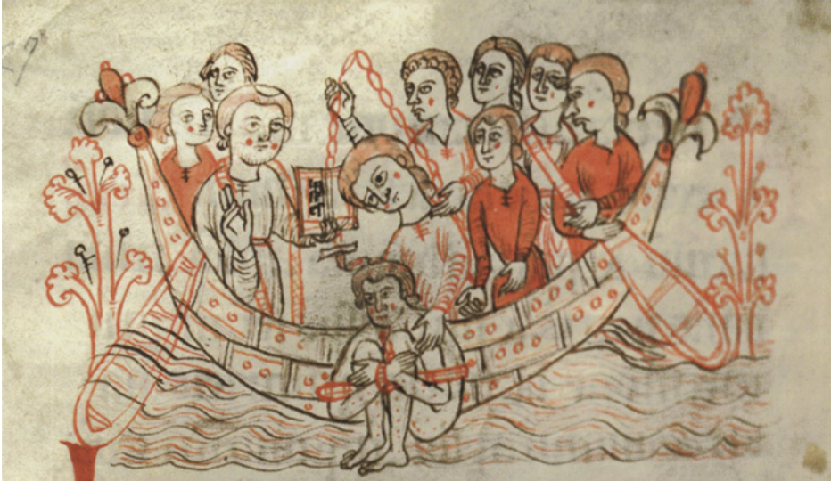
2. De waterproef als godsoordeel. (handschrift uit de twaalfde eeuw in Stiftsbibliothek Lambach)

procespartijen moest ondergaan, waarvan de uitkomst werd geacht het oordeel van de Hoogste Rechter in te houden over het gelijk of ongelijk van deze partij. In de Nederlanden waren als godsoordelen diverse vuur- en waterproeven in gebruik. Degene die een dergelijke bewijsproef moest ondergaan, diende bijvoorbeeld een gloeiend stuk ijzer beet te pakken, of hij moest met zijn hand een steen uit een ketel kokend water pakken. Bij deze proeven was het genezingsproces van de opgelopen brandblaren bepalend voor het waarheidsgehalte van iemands beweringen. 4