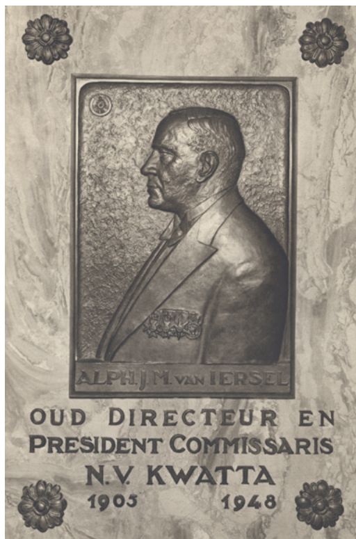
7. Plaquette voor oud-directeur en president-commissaris van Kwatta uit 1948. Waarschijnlijk gemaakt naar aanleiding van zijn overlijden op 17 juni 1948.