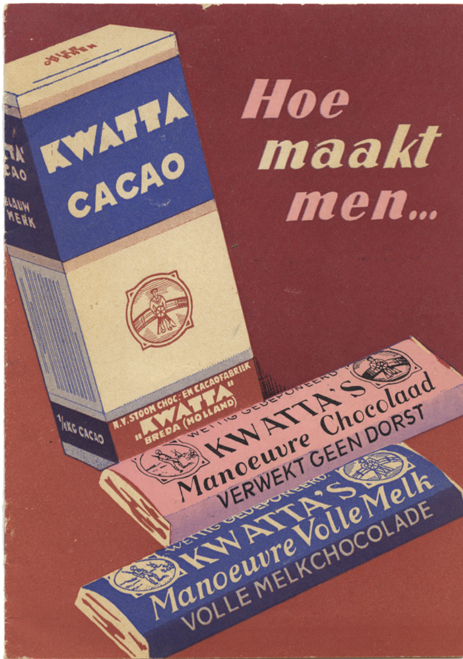
3. Boekje uit de serie Hoe maakt men... ? Met uitleg over fabricageproces bij Kwatta. (Stedelijk Museum Breda, GT04893)